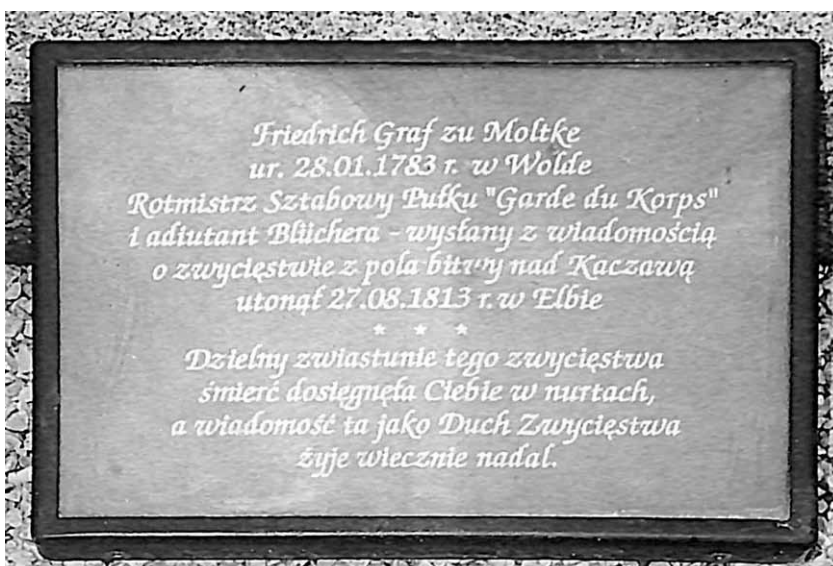
Oparte niegdyś o płytę nagrobną polskie tłumaczenie inskrypcji.