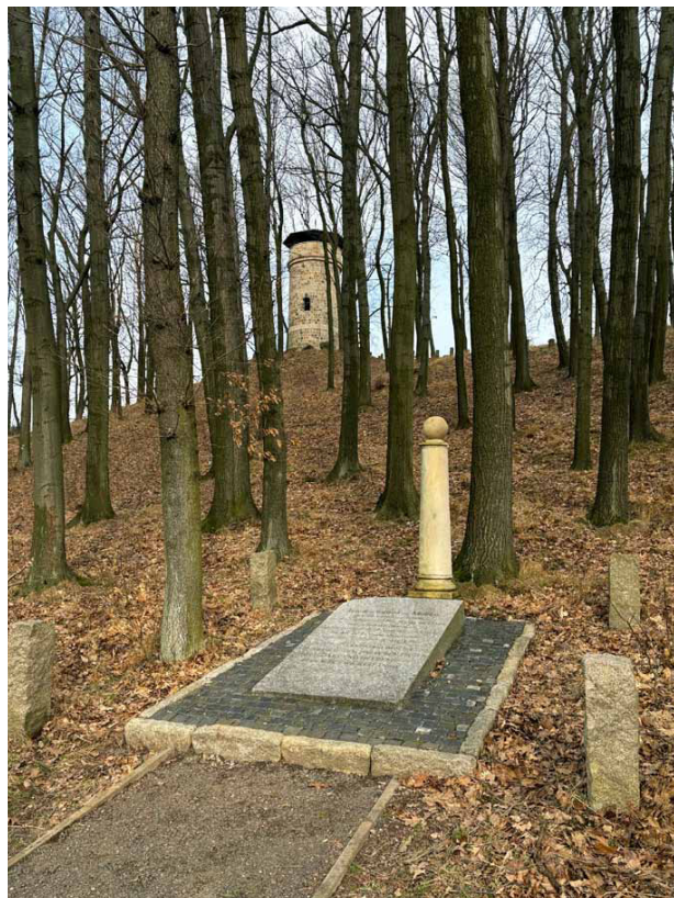
Nagrobek hrabiego von Moltke na tle wieży widokowej. Fotografia: Marian Gabrowski, luty 2024

4 Henke, Ehrengabmal für den Katzbachsiegesboten , [w:] Der Wanderer im Riesengebirge, nr 1/1914, s. 10.