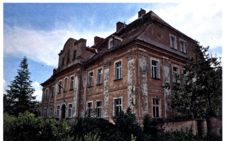
4. Pousterny dwór przy bolkowskiej ul. Kopernika. Fot. Marian Gabrowski, czerwiec 2019

spadkobiercy; i co w niniejszym tekście jest najważniejsze, nie sprzedawano zamku wraz z miastem, gdyż to już od niemal stulecia nie wchodziło w skład tego majątku. Pewną ciekawostką jest fakt, że choć dobra zamkowe składały się z 6 wiosek 11 , to liczne