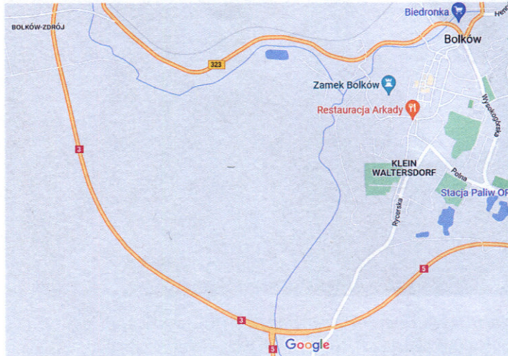
5. Klein Waltersdorf jako współczesna dzielnica Bolkowa.

W rozważaniach naszych pojawia się jednak pewna wątpliwość. Skoro zamek Bolków, będący niegdyś własnością cystersów, znajduje się na terenie miasta Bolków, to czy w związku