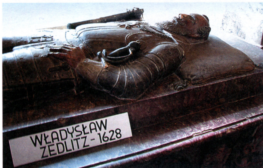
1. Fragment krzeszowskiego nagrobka Władysława Zedlitz. Fot. Marian Gabrowski, lipiec 2008

Bolków i Krzeszów to jedne z najbardziej znanych miejsc turystycznych Dolnego Śląska. Ich losy są niewątpliwie doskonale znane i na przestrzeni wieków zostały już wielokrotnie opisane. Z pewnością znajdują się jakieś epizody w ich historii, które mogą wymagać dalszych badań, ale wydaje się, że odpowiedź na postawione w tytule pytanie powinna być znana albo przynajmniej łatwa do odszukania w dostępnych publikacjach.