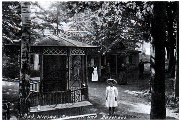
6. Pocztówka z uzdrowiska Bad Wiesau.

Wzniesione tu przez cystersów zabudowania, np. nieco dziś zaniedbany barokowy dwór przy ul. Kopernika 1, stojący niegdyś w centrum folwarku, cały czas przypominają o swoich budowniczych, dawnych właścicielach tych ziem. W 1929 r., ponad sto lat po likwidacji zakonu, wioska została włączona do miasta Bolkowa 14 i pamięć o niej niemal całkiem przeminęła. Jednak nazwa ta niekiedy potrafi pojawić się całkiem niespo-