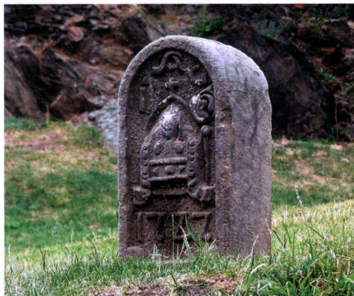
2. Ustawiony na terenie zamku w Bolkowie kamień graniczny opactwa krzeszowskiego. Fot. Marian Gabrowski, lipiec 2008

zawarł też zastrzeżenie, że każdy kolejny spadkobierca zamku Bolków musi przynależeć do Kościoła rzymskokatolickiego.