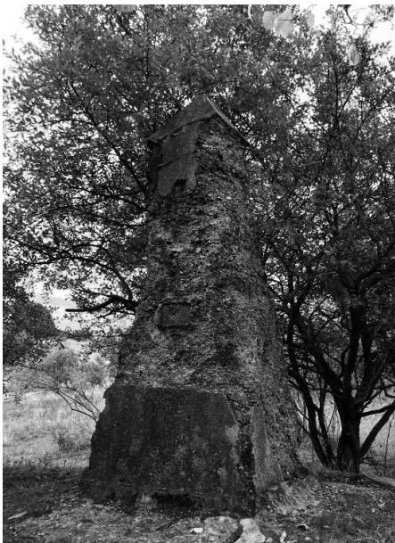
Das rätselhafte Denkmal von Ruhbank.

In der August-Ausgabe des Schlesischen Gebirgsboten habe ich das Völkerschlacht- und Kaiser-Wilhelm-II.-Denkmal in Ruhbank beschrieben, das ein Beispiel für ein interessantes und sehr gut erhaltenes Denkmal aus dem Kreis Landeshut ist. Es ist jedoch erwähnenswert, daß weniger als anderthalb Kilometer entfernt, ebenfalls auf