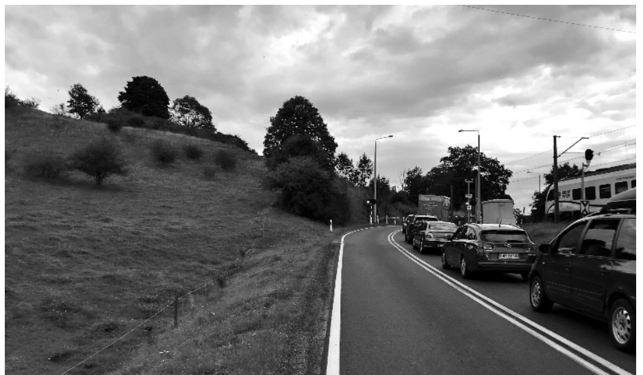
Straße zwischen Merzdorf und Krausendorf, links oben „im Pusche“ das Denkmal.

Es ist kein Problem, diesen Ort zu erreichen. Ich möchte jedoch darauf hinweisen, daß die Hänge dieses Berges derzeit als