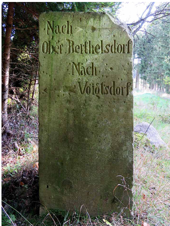
Informacje na temat kierunków dróg wiodących do górnej części Uniemyśla i Wójtowej