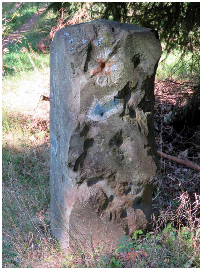
Zniszczony bok kamiennego drogowskazu

i niewątpliwie to właśnie chełmski oddział tejże organizacji w 1913 roku ustawił kamienny znak. Informacji na ten temat poszukiwałem w oficjalnym piśmie stowarzyszenia, jednak natrafiłem jedynie na wzmiankę, że w 1913 roku miejscowy oddział zajmował się między innymi gruntownym ulepszaniem ścieżek, lawek i drogowskazów 4 . W kolejnym zaś roku uroczyście obchodzono 25-lecie tutejszej sekcji Towarzystwa Karkonoskiego i między innymi ukończono modernizację pieszego szlaku wiodącego do Ober Adersbach 5 .