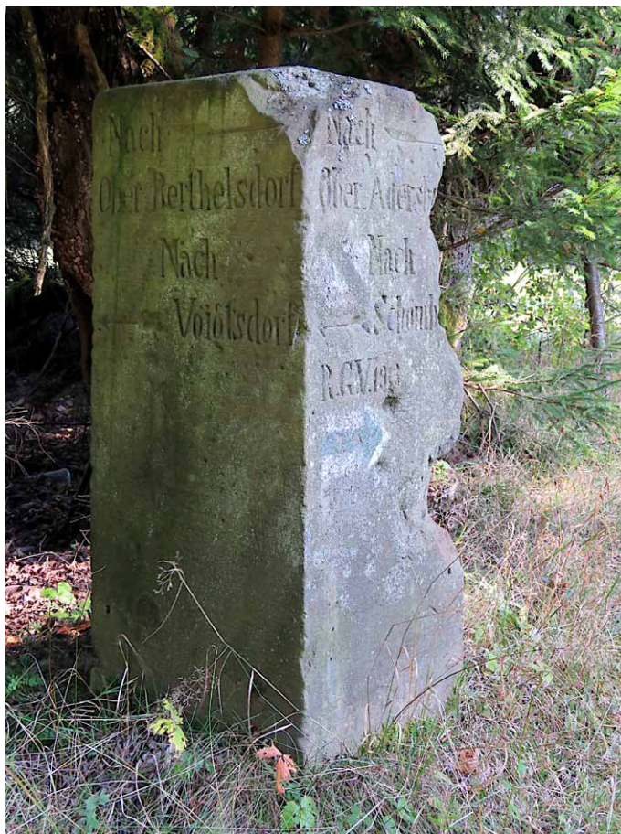
Kamienny drogowskaz z okolic Złotej Góry. wrzesień 2023