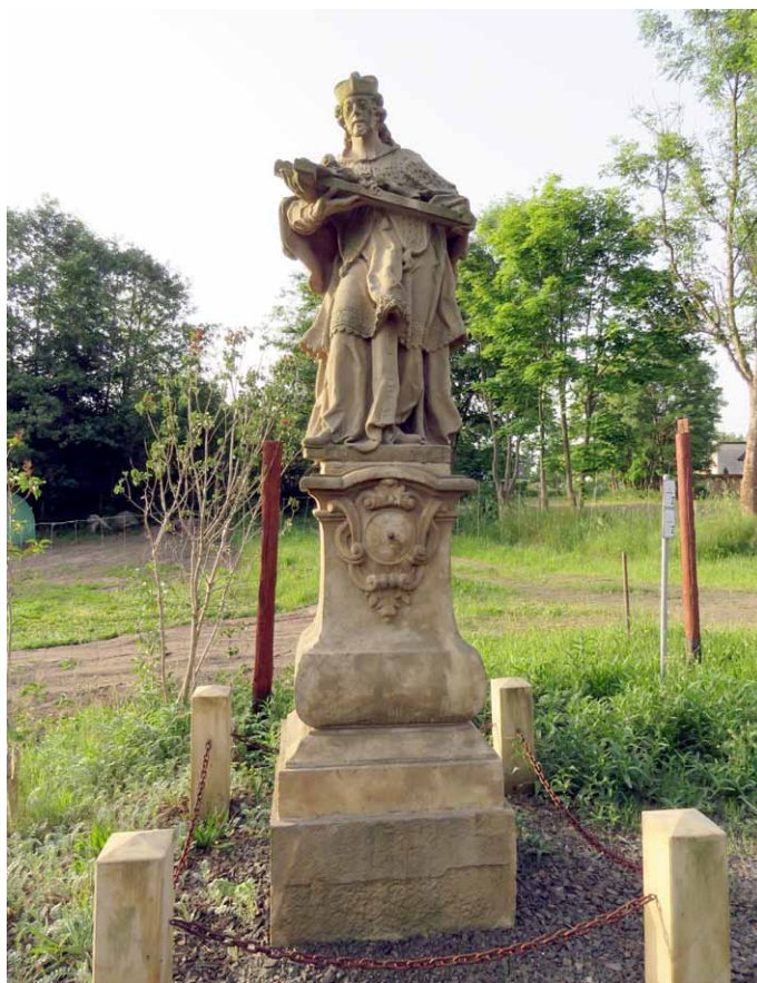
Figura św. Jana Nepomucena z Czadrowa.

Jednak jak ustalić pochodzenie tego pomnika? Mógł on tu być przeniesiony zarówno z jakiejś nieodległej wioski, jak i z miejscowości odległej o setki kilometrów. Gdzie zdobyć informacje na ten temat?