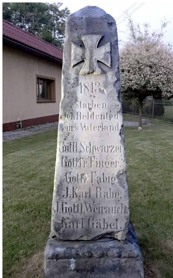
Obelisk z Czadowa

Pięć lip rosnących na południe od ruin kościoła ewangelickiego w Miskowicach. Pień szóstej, wyciętej jakiś czas temu, w dalszym ciągu leży koło pozostałości