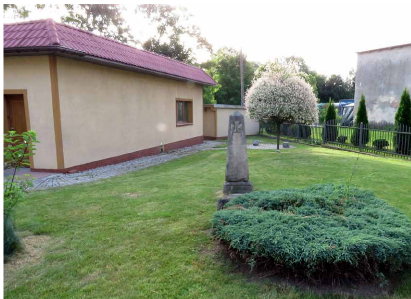
Ustawiony w Czadrowie pomnik poległych żołnierzy