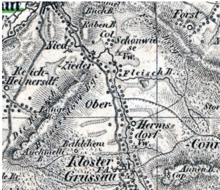
1. Fragment mapy Kreiskarten von Schlesien , op. cit., ukazującej okolice dzisiejszego Krzeszowa.