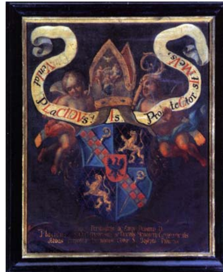
Rysunek 2: Reprodukacja obrazu z krzeszowskiego klasztoru, Herb opata krzeszowskiego Placyda 15