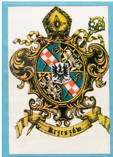
Rysunek 3: Reprodukacja herbu, która znajdowała się przy wejściu na plac kościelny krzeszowskiej bazyliki 16