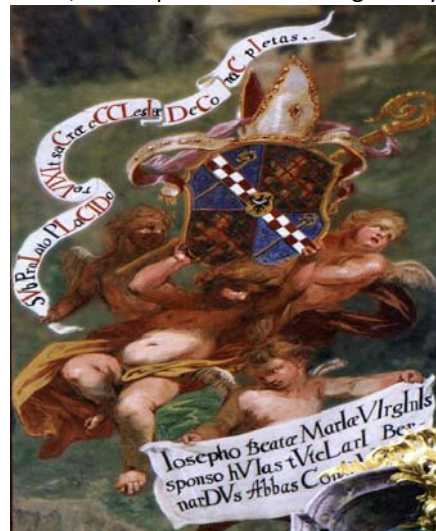
Rysunek 4: Detal z kościoła Św. Józefa w Krzeszowie 17