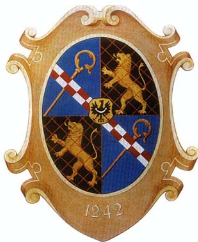
Das Wappen der Abtei Grüssau

Najdłuższym posiadaczem wsi byli krzeszowscy Cystersi. Zachowało się wiele przedstawień herbu opactwa krzeszowskiego.