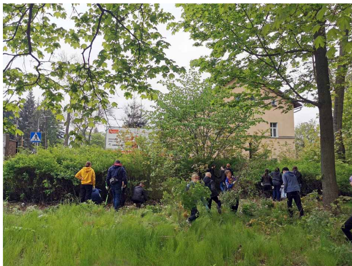
Młodzież szkolna podczas prac porządkowych na dawnym cmentarzu.

Jednak dziś miejsce to wygląda już całkiem inaczej. W maju bieżącego roku Krzysztof Jawor, nauczy-