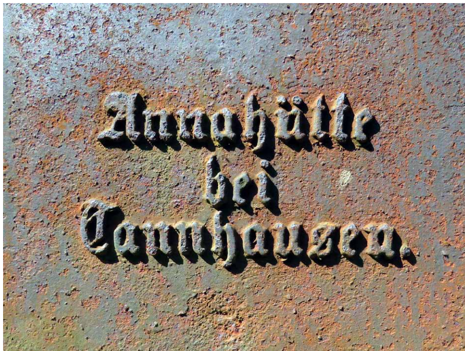
Napis na podstawie krzyża. Foto: Marian Gabrowski, czerwiec 2023 roku

Tak więc upamiętnienie to powstało w odlewni żeliwa Annahütte zlokalizowanej koło dawnej Jedlinki (niem. Tannhauzen ), będącej dziś częścią miasta Jedlina-Zdrój w powiecie wałbrzyskim. Zapewne chodzi tu o Hutę Anna, która w rzeczywistości znajdowała się w leżącej po sąsiedzku wiosce Grzmiąca (niem. Donnerau ), a więc 25 km w linii prostej na wschód od Lubawki. Zakład ten funkcjonował w latach 1855-1914, czyli krzyż odlano w 11. roku jego działalności.