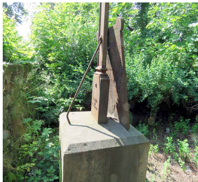
Odślonięta podstawa pomnika. Foto: Marian Gabrowski, czerwiec 2023 roku

ciel lubawskiej szkoły, zamieścił na prowadzonej przez siebie facebookowej grupie „Moja Lubawka” następujący wpis: