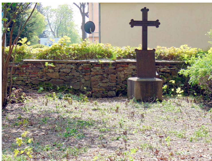
Sąsiedztwo nagrobka po usunięciu nadmiaru zieleni.