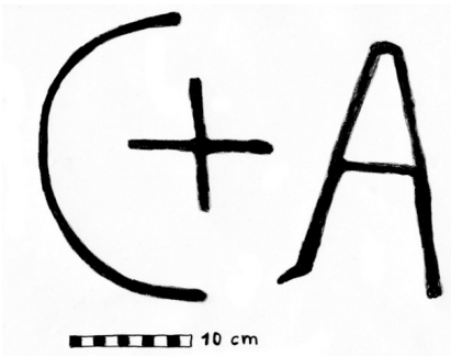
Ilustracja 2: Odrys znaków „C+A” wykutych na kamieniu granicznym. Znak „+” zbudowany jest z krzyżujących się linii długości ok. 12 cm, litera „C” jest częścią okręgu o średnicy ok. 24 cm, natomiast litera „A”, nieznacznie przekreślona w prawo, ma wymiary ok. 13x22 cm.

W końcu jednak odnalazłem poszukiwany kamień z napisem „C+A” (patrz ilustracja 3). Znajduje się on w odległości ok. 2,5 km od szczytu Martwca i zaledwie ok. 1 km od szczytu Krupná Hora. Dokładnie w tym miejscu granica państwowa gwałtownie się załamuje, niemalże pod kątem prostym, a jej przebieg zmienia się ze spokojnego biegu zboczem góry na strome zejście w dół. Sam kamień jest na całe szczęście bardzo trudny do przeoczenia, sąsiaduje on ze współczesnym znakiem granicznym III/247.