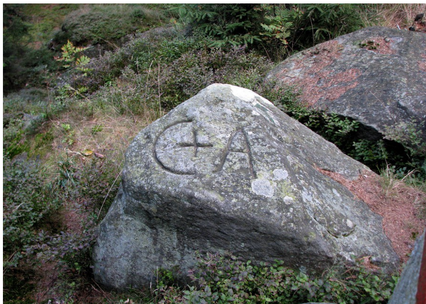
Ilustracja 3: Kamień graniczny z wykutymi literami „C+A”. Fotografia: Marian Gabrowski, wrzesień 2008.

Warto zwrócić tu uwagę na fakt, że opisywany kamień znajduje się dokładnie na granicy miejscowości Uniemyśl i Aadršpach. Prawdopodobnie tenże właśnie kamień graniczny przedstawiony jest też na mapie katastralnej z 1840 roku 2 , gdzie w interesującej mnie lokalizacji ukazane są litery „CA” (bądź też „GA” - być może tak właśnie niegdyś odczytano znaki „C+A”?); litery te znajdują się w pewnej odległości od cyfr tworzących datę „1591”.