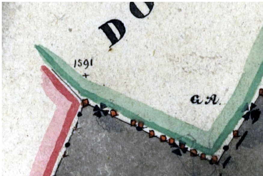
Ilustracja 4: Fragment wykonanej w 1840 roku mapy katastralnej „Dorf Ober Andersbach böhmisch Anderspach Hořeny...”, [2]. W bezpośrednim sąsiedztwie zachowanych do dziś charakterystycznych załamań granicy widoczne są napisy „1591” oraz „CA” (bądź też „GA”).

mapie katastralnej. Ponieważ w latach 1576-1609 krzeszowskim opatem był „Kaspar II. Ebert” 3 , a imię Kacper po łacinie zapisywane jest w formie „Caspar” 4 , toteż litery „CA” mogłyby oznaczać „Caspar Abbas”, czyli znak graniczny ustawiony za czasów opata Kacpra.