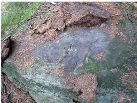
Ilustracja 1: Znak „+” wykuty na granicy miejscowości Uniemyśl i Adršpach, czyli na granicy polsko-czeskiej.

Martwiec (lub czeski Mrtvý vrch ) to szczyt w Zaworach, leżący niemal dokładnie na granicy polsko-czeskiej. „Słownik geografii turystycznej Sudetów” w opisie Martwca wspomina: „Pod szczytem Martwca zachował się stary kamień graniczny. Nieregularny blok posiada wykute litery »C+A«, będące najprawdopodobniej oznaczeniem granic posiadłości opactwa krzeszowskiego” 1 .