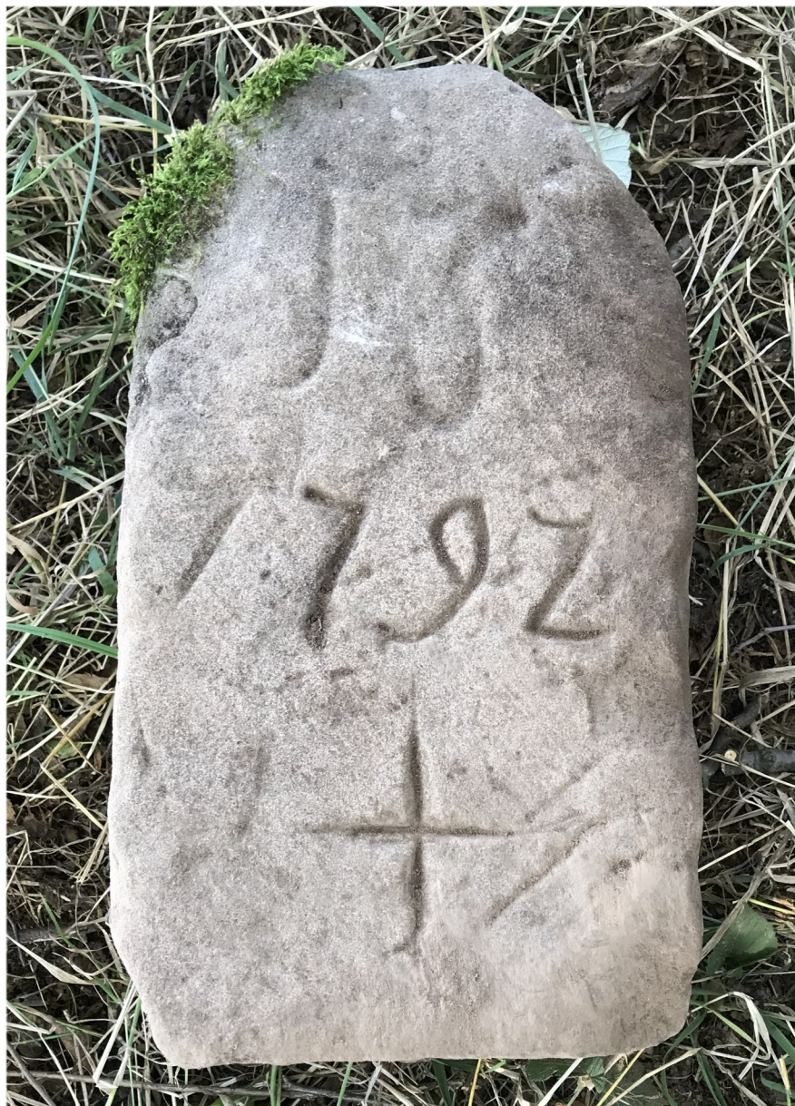
Ilustracja 49: Kamień z granicy Grzęd Górnych i Kochanowa. wrzesień 2019 roku.