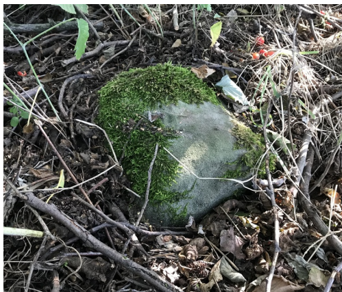
Ilustracja 48: Wystający z ziemi wierzchołek kamienia granicznego.