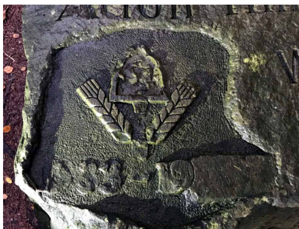
Godło widoczne obok inskrypcji