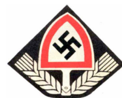
Odmiana godła RAD zawierająca symbol swastyki.

Adolf Hitler-Bergstraße Werk der deutschen Jugend! 'nst-Abteilung 115/4 Friedland