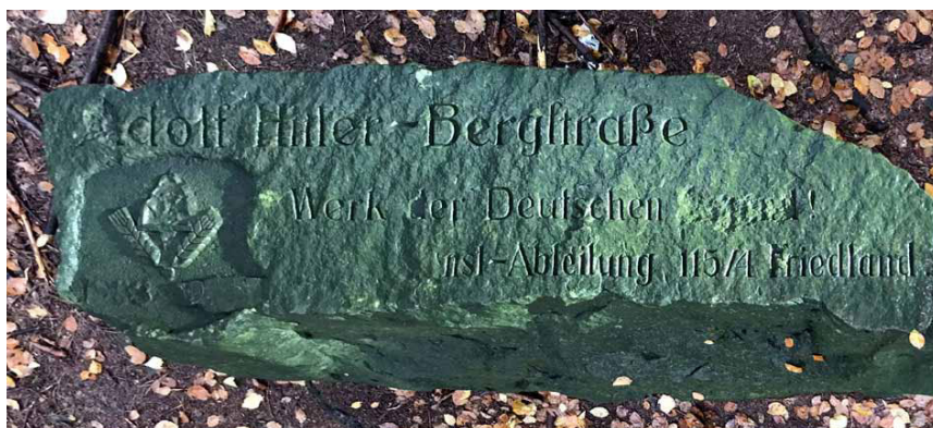
Inskrypcja na górnej powierzchni kamienia

Właśnie tu, w odległości zaledwie kilku metrów od drogi, leży olbrzymi głaz. Jego górna powierzchnia ma wymiary ok. 70×240 cm, grubość całości to nieco ponad 90 cm. Tylko skierowana ku niebu płaszczyzna została obrobiona, a na powstałej w ten sposób powierzchni wyryto w trzech wersach inskrypcję: