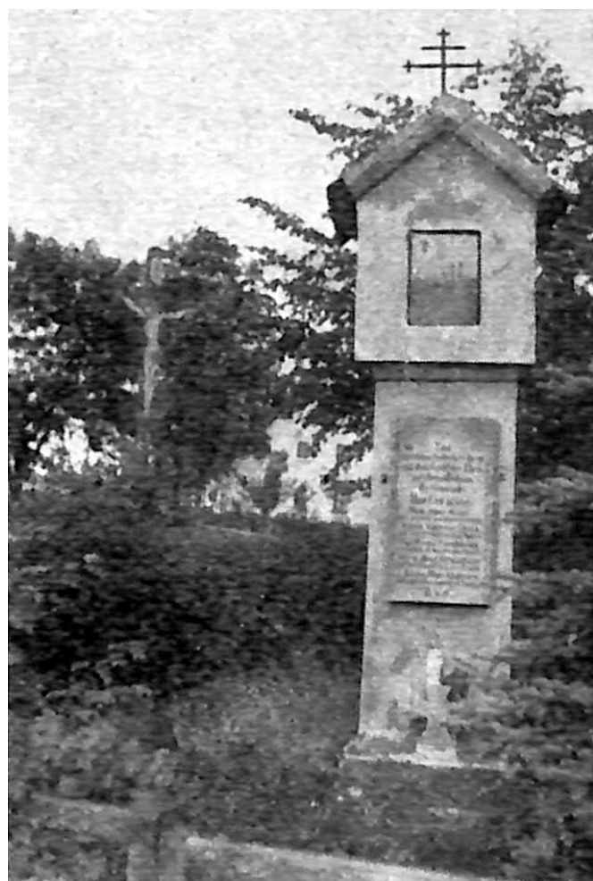
Kapliczka z dawnej wioski Hartau z zamontowaną tablicą.