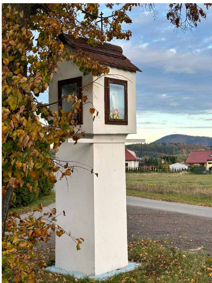
Kapliczka z Borówna będąca niegdyś również pomnikiem. Na drugim planie widoczna góra Chełmiec. Foto: Marian Gabrowski, listopad 2023 roku