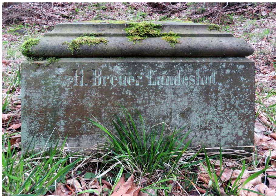
Cokół pomnika, bok z informacją o wykonawcy