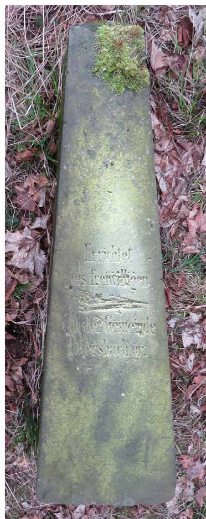
Zdjęcia ukazujące przód (po lewej) i tył obelisku (po prawej). Wszystkie fotografie w artykule: Marian Gabrowski, kwiecień 2023 roku