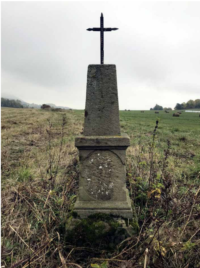
Pomnik-kapliczka widziany od zachodu