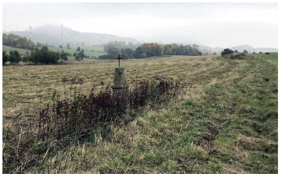
Widziany od zachodu pomnik-kapliczka pośród pól.