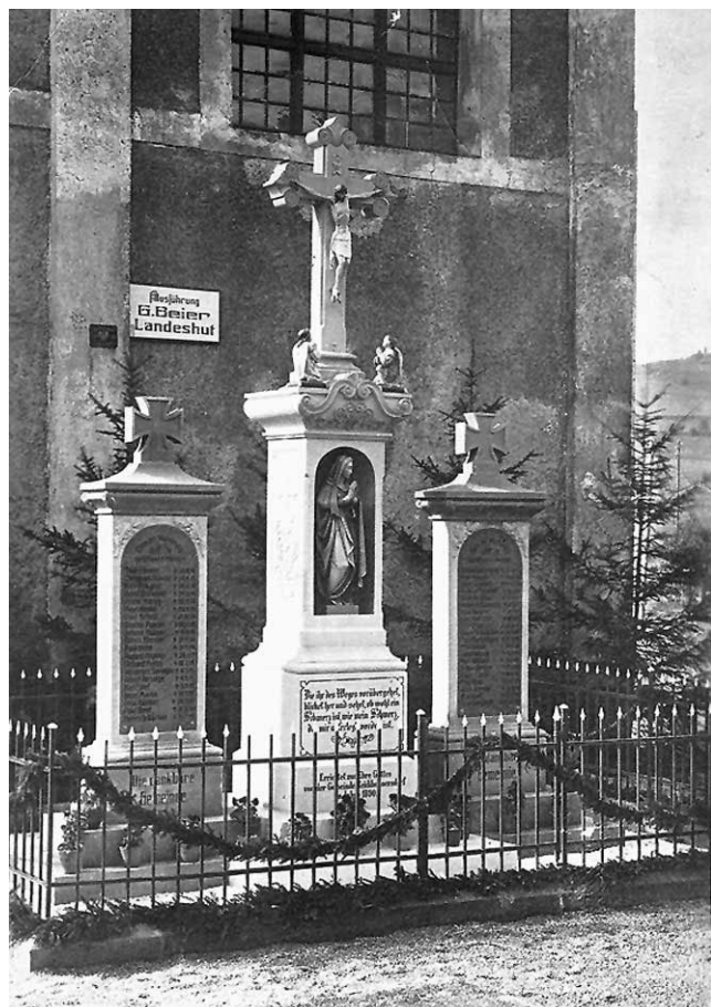
1. Przedwojenne zdjęcie ukazujące pomnik w wiosce Reichhennerdorf (pol. Przedwojów)

Przedwojów to wioska leżąca pomiędzy miastami Kamienna Góra i Lubawka. Nie wiadomo kiedy dokładnie miejscowość ta powstała, po raz pierwszy wzmiankowano ją w 1350 roku, kiedy to została sprzedana klasztorowi cystersów z Krzeszowa, którego własnością była aż do jego sekularyzacji w 1810 roku. To właśnie ci zakonnicy w samym centrum wioski wybudowali najbardziej znany z tutejszych zabytków kościół pw. św. Józefa Oblubieńca NMP. Na początku XX wieku przed tą niewielką świątynią wzniesiono pomnik upamiętniający mieszkańców Przedwojowa poległych w czasie pierwszej wojny światowej.