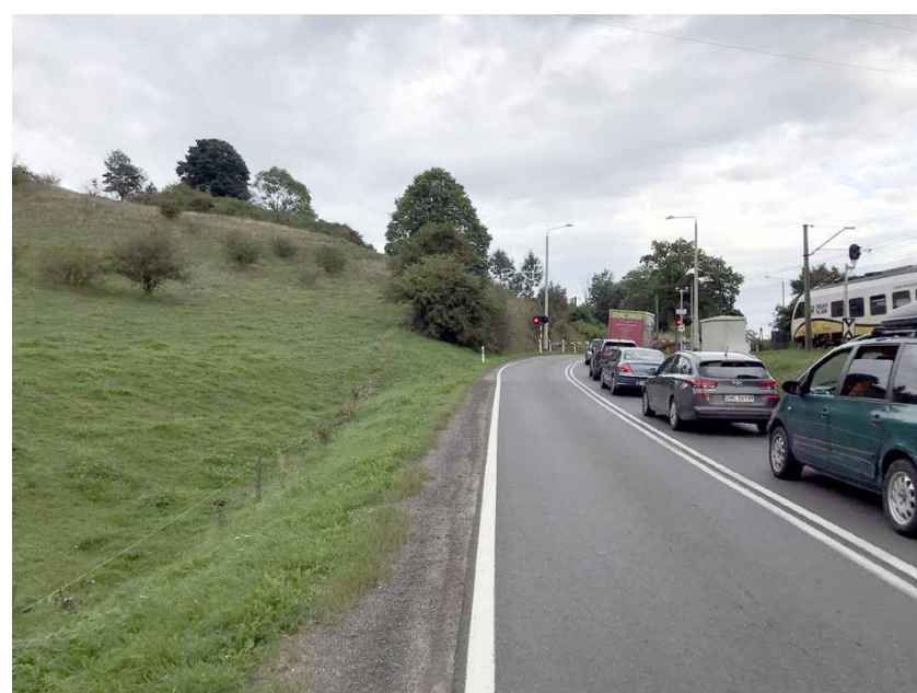
Marciszów, przejazd kolejowy w miejscu, gdzie droga krajowa nr 5 przecina linię kolejową z Wałbrzycha do Jeleniej Góry. W zaroślach na wzgórzu po lewej stronie znajdziemy opisywany tu pomnik

branych dotąd informacji nie potrafię ustalić, czego dotyczyło to upamiętnienie. Niewątpliwie nie był to pomnik poświęcony żołnierzom poległym w czasie Wielkiej Wojny, gdyż takowy wzniesiono w 1920 roku w centrum Sędziszawia i wryto na nim nazwiska mieszkańców wiosek Ruhbank i Neu-Merzdorf.