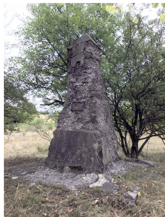
Zagadkowy pomnik z Sędziszawia widziany od przodu

Poza kilkoma mapami, które ukazują w tym miejscu symbol pomnika, żadne z innych znanych mi źródeł nie wspomina o tym obiekcie. Dlatego na podstawie ze-