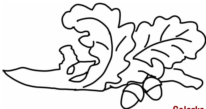
Gałązka dębowa wyryta w dolnej części pomnika