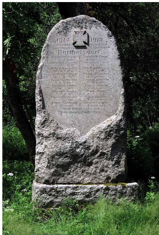
Pomnik w wiosce Uniemyśl.