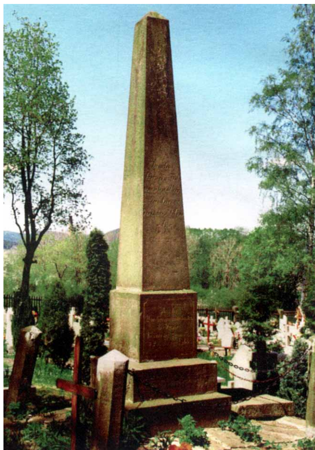
Tablica leżąca przed obeliskiem (po prawej).