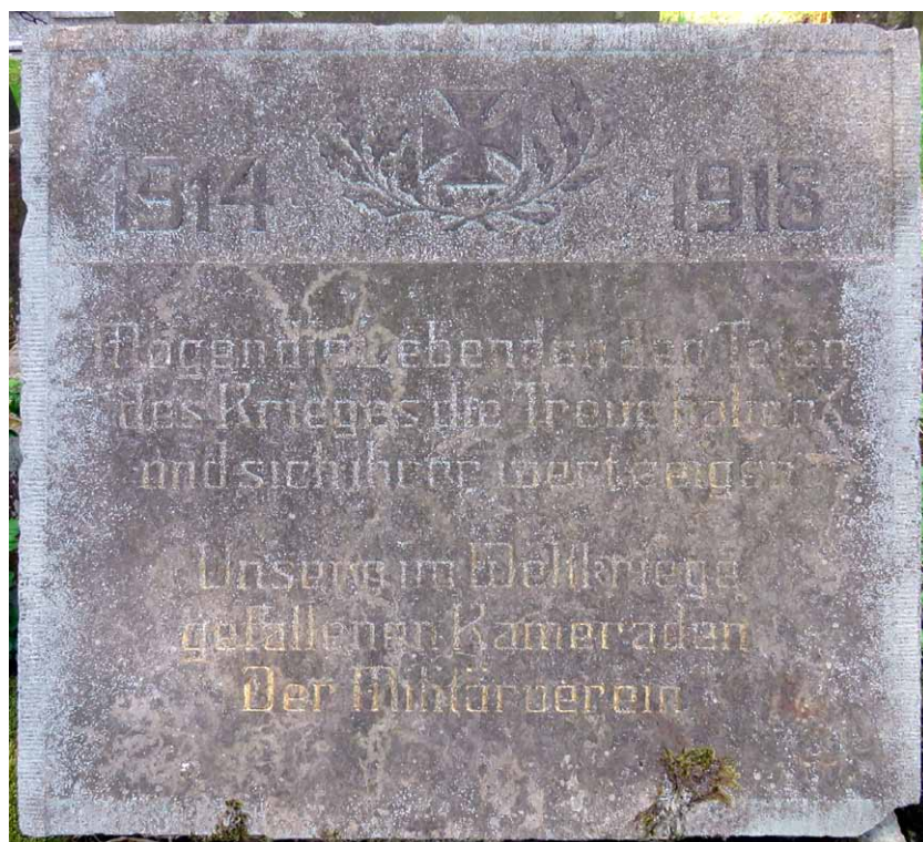
Przednia powierzchnia tablicy pamiątkowej