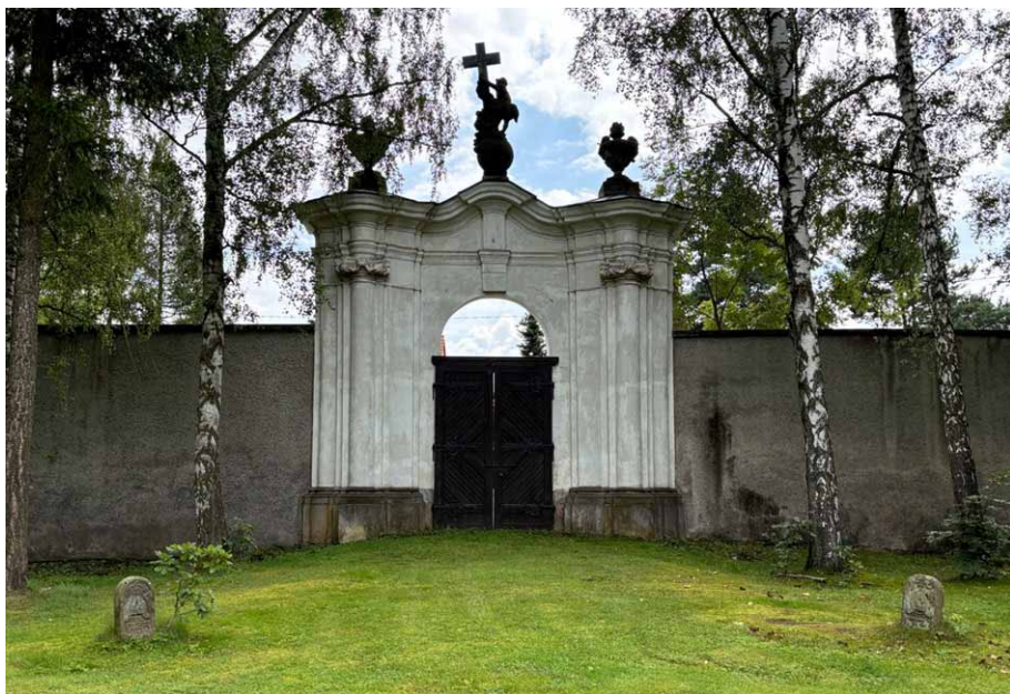
Kamienie graniczne ustawione przed bramą w ogrodzie klasztornym. Wszystkie współczesne zdjęcia: Marian Gabrowski, sierpień 2024 roku

Wydaje się, że dwa z tych kamieni w dalszym ciągu stoją tam, gdzie je ustawiono w 1938 roku. Znajdziemy je po obu stronach bramy prowadzącej z ogrodu klasztornego na ul. Świętej Jadwigi Śląskiej. Pomiędzy