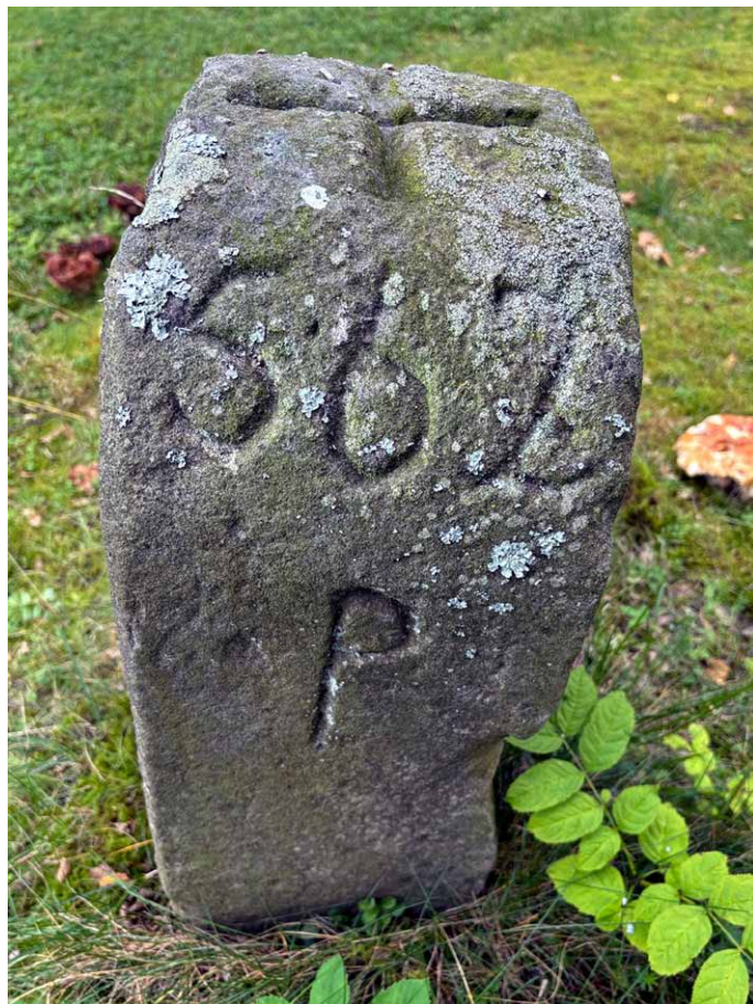
Prawy kamień z wyrytą liczbą 562 oraz literą P

Na szczycie słupków znajdują się typowe dla znaków granicznych krzyże, tutaj zbudowane z linii o długości 14 cm. Z prawej strony każdego kamienia wyryte są numery porządkowe: na lewym kamieniu jest to liczba 565, natomiast na prawym liczbę 562 uzupełniono umieszczoną poniżej literą P.