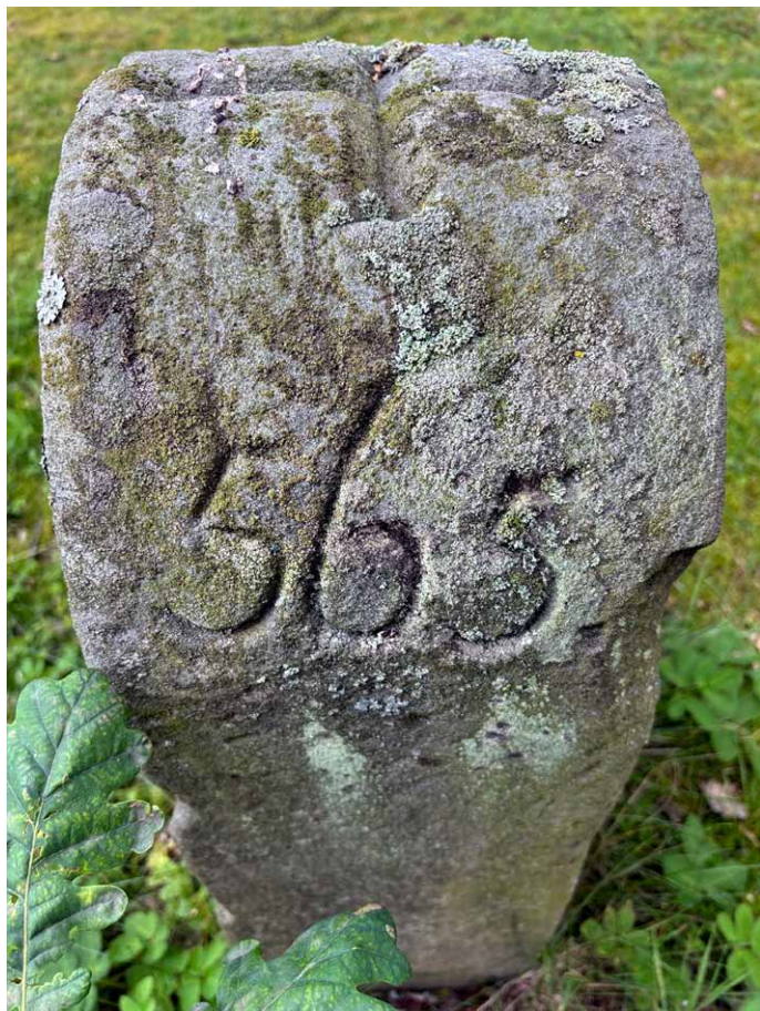
Liczba 565 wyryta na lewym kamieniu

Na przedzie każdego z kamieni znajdują się ozdobne wypukłe inicjały IAG, będące skrótem od łacińskich wyrazów Innocentius Abbas Grissoviensis , czyli Innocenty opat krzeszowski . Poniżej znajduje się pastorał z mitrą, a na samym dole data 1727. Choć zapewne w zamierzeniu kamienie miały być takie same, to widać wyraźnie, że każdy z nich ma nieco odmienne płaskorzeźby.