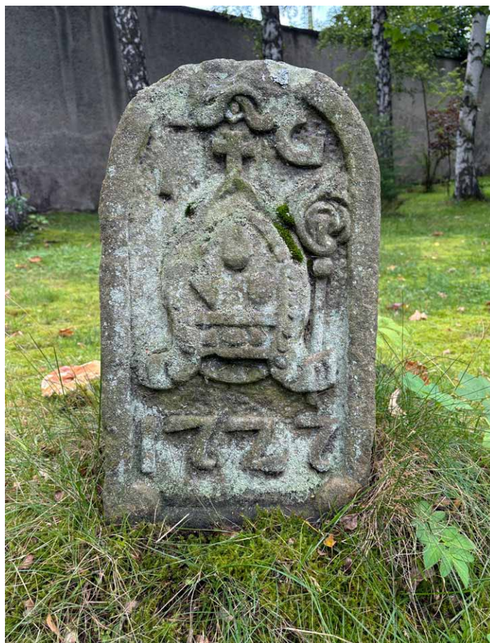
Kamień ustawiony po prawej stronie bramy