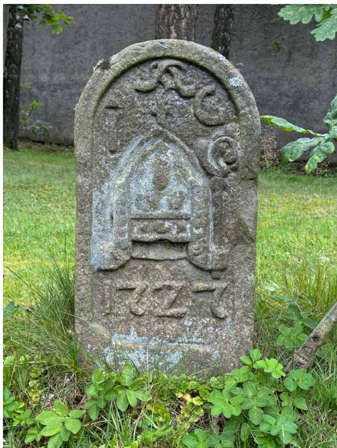
Kamień ustawiony po lewej stronie bramy