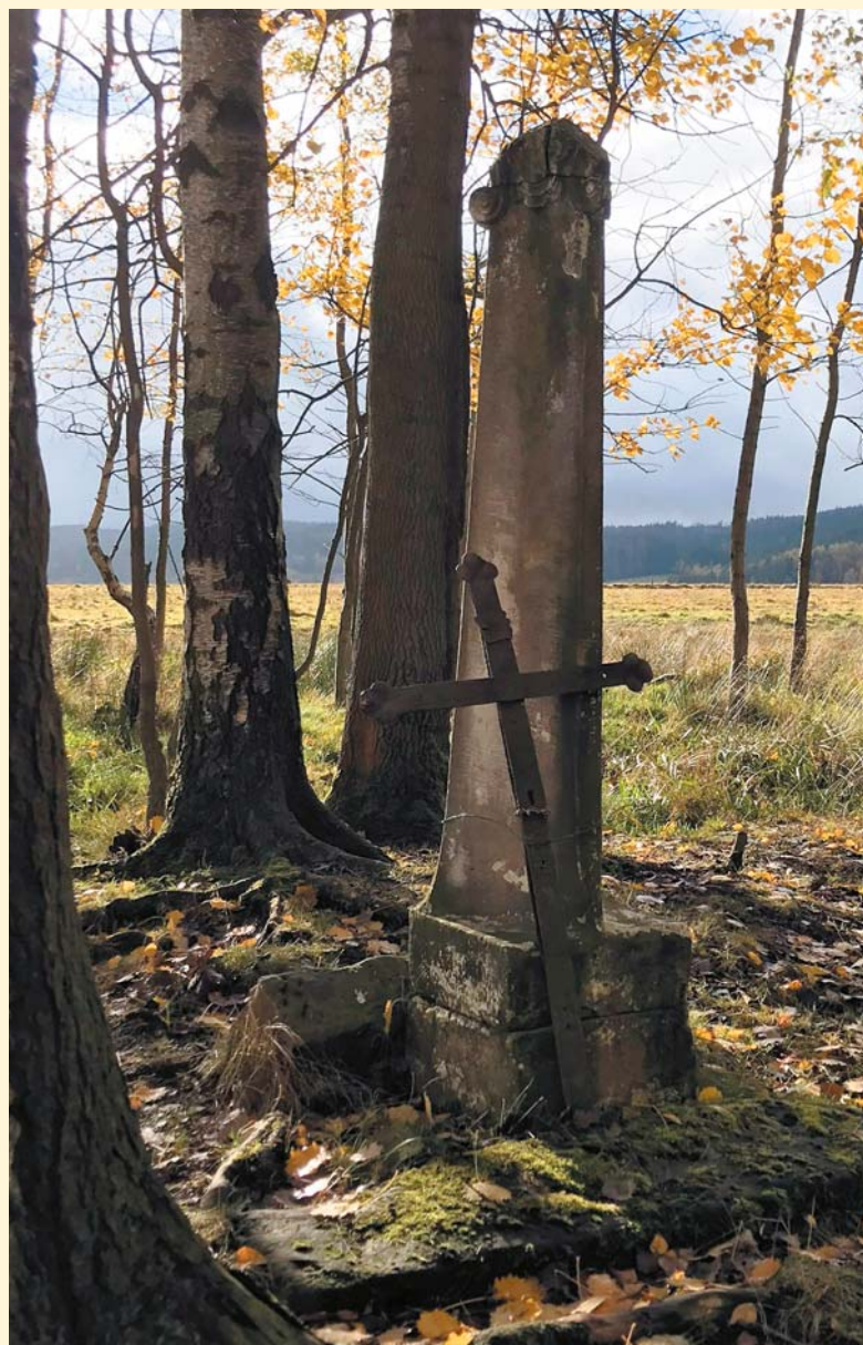
Kapliczka z opartym krzyżem.

Kiedy w latach osiemdziesiątych ubiegłego wieku wybudowano drogę z Lubawki do Chełmska Śląskiego i w tym celu wzniesiono wysoki nasyp drogowy, nasyp ten zablokował odpływ wody źródlanej. Dlatego łąka stała się podmokła, ale źródło zachowało