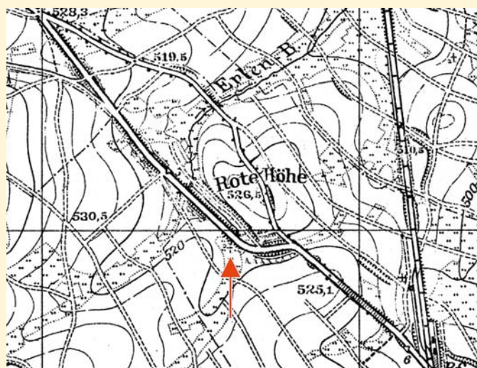
Fragment przedwojennej mapy topograficznej z zaznaczoną kapliczką przydrożną w sąsiedztwie góry Rudna