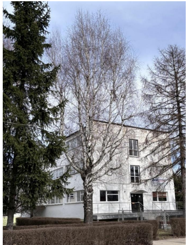
Die vermutliche Fouqué-Birke.

Obwohl an den anderen Schauplätzen der blutigen Kämpfe, die 1760 in der Umgebung von Landeshut stattfanden, Steinmonumente errichtet wurden, markierte hier eine einsame Birke, die auf den Wiesen hinter dem Bahnhof wuchs, den Ort, an dem der General gefangen genommen wurde. Quellen aus dem frühen 20. Jahrhundert beschreiben sie als Naturdenkmal von großer historischer Bedeutung. Der ursprüngliche Baum aus der Zeit der Schlacht konnte die Jahrhunderte nicht überstehen, weshalb an seiner Stelle weitere gepflanzt wurden. Es ist bekannt, daß eine dieser Birken 1941 durch einen Blitzschlag zerstört wurde, was den örtlichen Riesengebirgsverein dazu veranlaßte, eine neue Birke zu pflanzen.