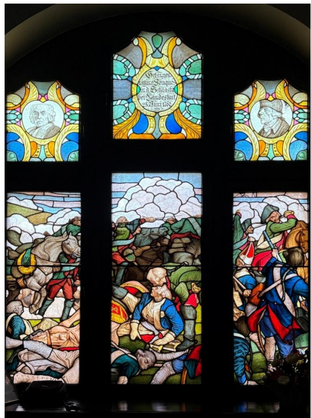
Rathausfenster mit einer Darstellung der Gefangennahme von General Fouqué.

Schlachtplan von 1760; die Nummer 10 markiert den Ort, an dem General Fouqué gefangen genommen wurde.