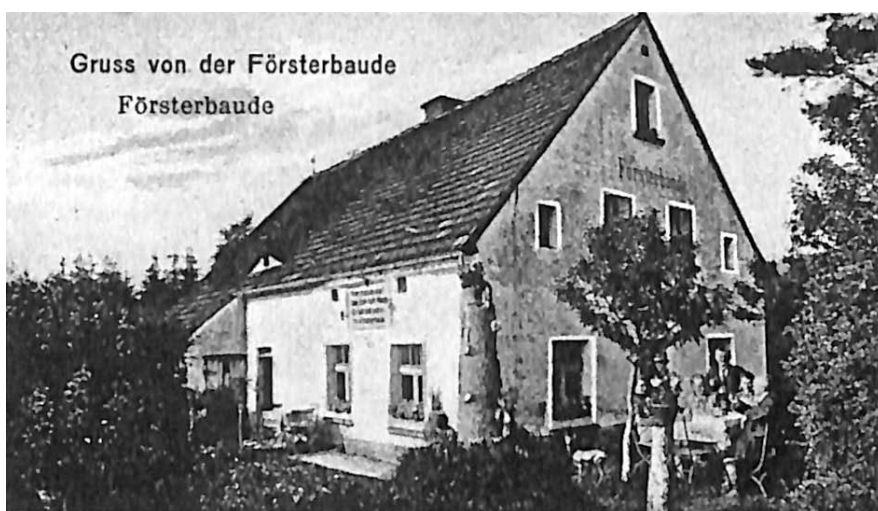
Fragment pocztówki z pozdrowieniami z Försterbaude . Na pierwszym planie widoczne upamiętnienie w formie pnia.

Z przodu, kilka centymetrów od wierzchołka, znajduje się owal z wrytą inskrypcją: