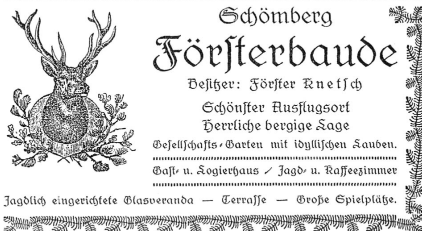
Reklama Försterbaude z 1925 roku.