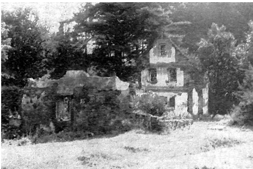
W 1968 roku z dawnego budynku Försterbaude pozostały już tylko nieliczne ściany.