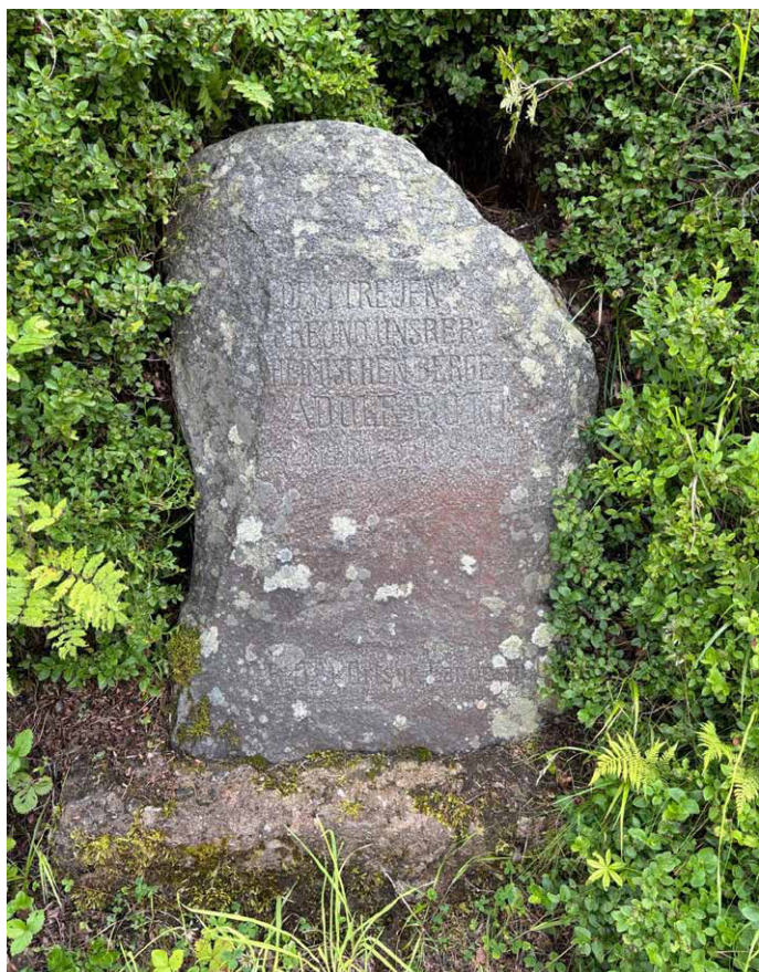
Kamień upamiętniający miejsce śmierci Adolfa Rotha. Zdjęcie: Marian Gabrowski, lipiec 2024 roku