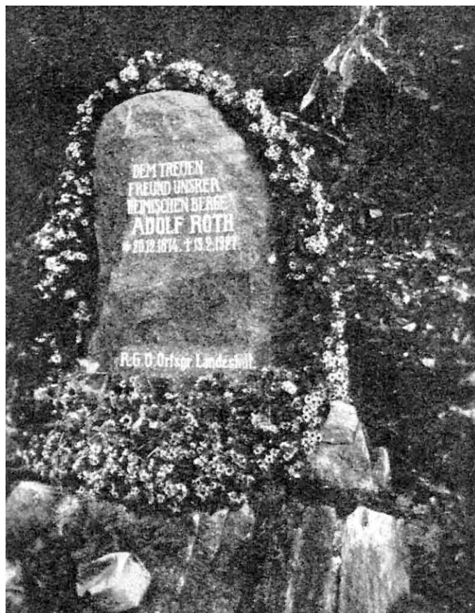
Udekorowany kwiatami kamień pamiątkowy w dniu jego odsłonięcia. rok 1929