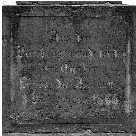
Inschriften auf der rechten Seite des Sockels.

Aus der Kirchengemeinde ruhen in fremder Erde 4 Krieger von 1870/71.