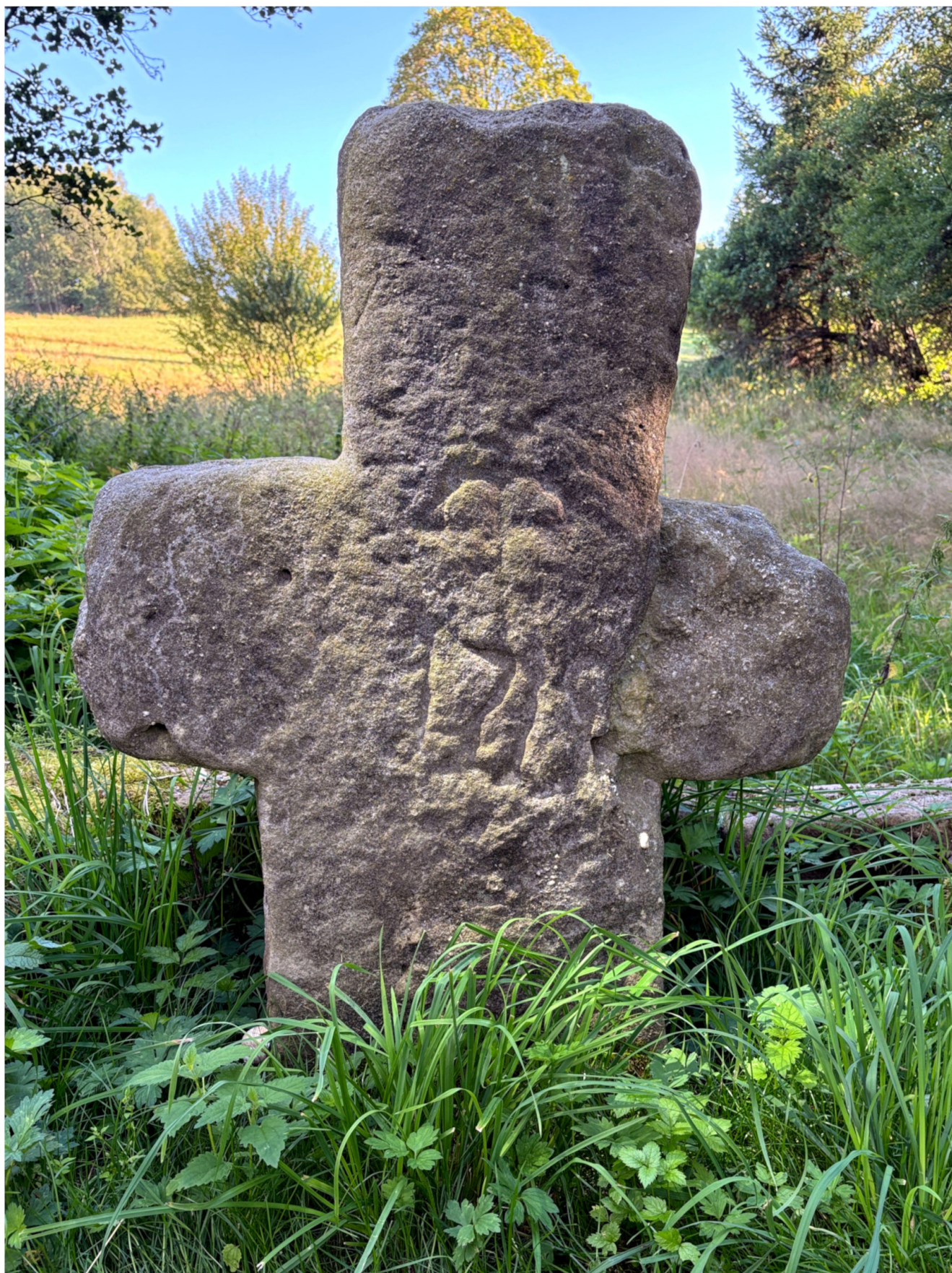
3. Krzyż z Okrzeszyna oświetlony intensywnym bocznym światłem. rok 2024.