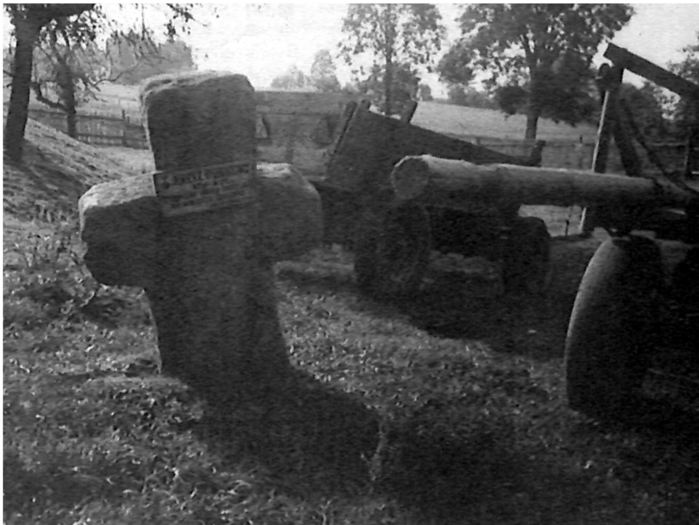
5. Krzyż z Okrzeszyna na zdjęciu ilustrującym artykuł Gerharda Gläsera z 1990 roku.

Ciekawy opis tego zabytku znalazłem w niemieckiej gazecie z 1990 roku. Gerhard Gläser, autor artykułu o kamiennych krzyżach, wspomina: Na koniec następujące informacje o krzyżu pojednania z Okrzeszyna: Lokalizacja jest chyba wszystkim znana, na krzyżu widnieje wyryta liczba 1719 oraz zakrzywiony miecz jako znak morderstwa. Według kroniki z Trutnova, w tym miejscu został zamordowany mnich podróżujący z Žacléřa do Broumova; z kolei mój dziadek powiedział mi około 1930 roku, że został tam zabity po pijanemu rosyjski oficer 6 .