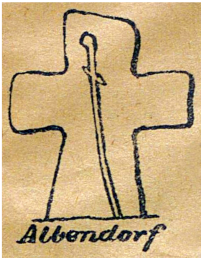
1. Rysunek kamiennego krzyża z rytem narzędzia zbrodni z Okrzeszyna (niem. Albendorf).

Rzeczywiście znane są liczne przykłady kamiennych krzyży, które niegdyś bądź to celowo ustawiano jako znaki graniczne, bądź też wtórnie przystosowywano do takiej roli 2 . Jednak moim zdaniem brak jest przesłanek przemawiających za tym, że tak właśnie było w przypadku krzyża z Okrzeszyna. Faktem jest, że zlokalizowany jest on w pobliżu granicy dóbr dwóch zakonów,