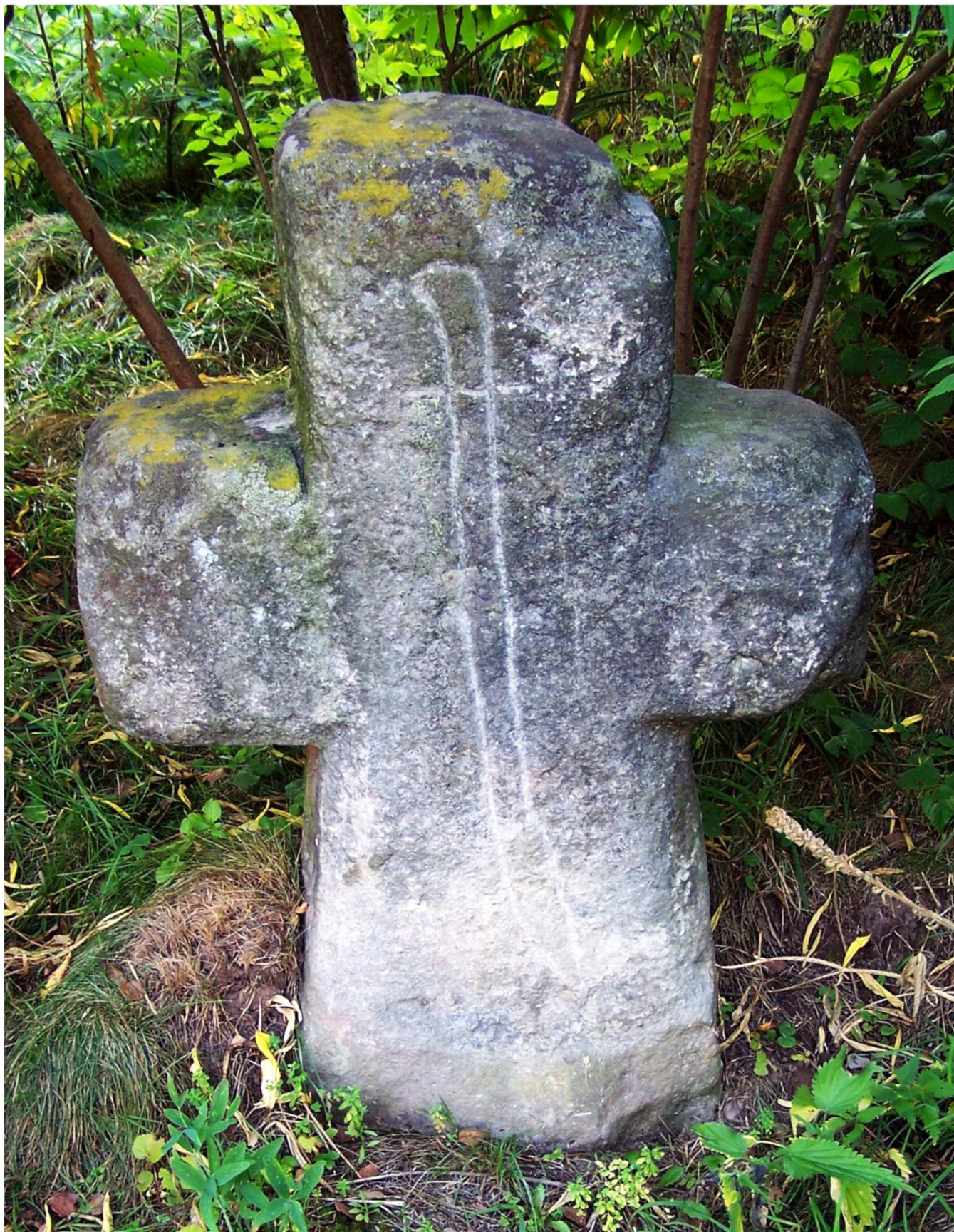
2. Zdjęcie kamiennego krzyża z Wambierzyc z rytem szabli. Fotografia: Witold Komorowski, rok 2009.