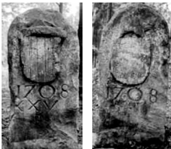
Ryc. 3. Kamień graniczny z herbami Schaffgotschów i opactwa w Krzeszowie

Wielokrotnie badano tę granicę lasu, na przykład w latach 1647, 1689, 1690, 1691, 1692, 1693. Dobrym źródłem informacji na temat tej posiadłości prepozytury cieplickiej jest malowana mapa „Spittelwaldes Mappe von 1692”, opatrzona literami A-Z wraz z ich objaśnieniami. Ten spór miał trwać ponad 100 lat. 21 października