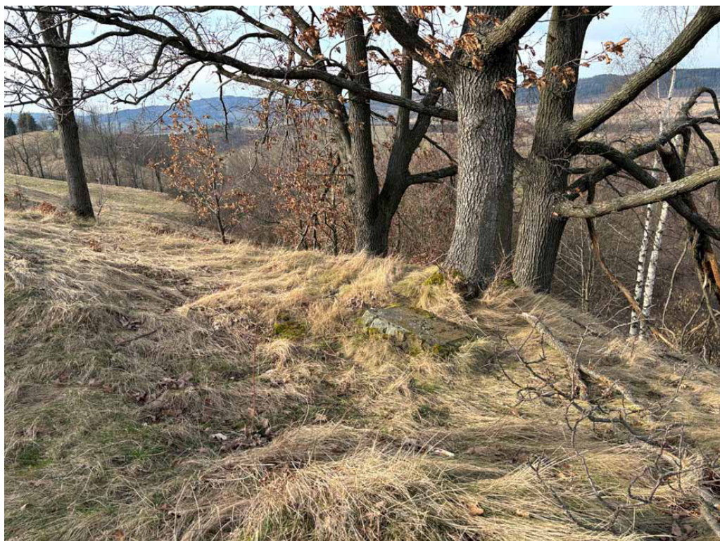
Płyta będąca pozostałością po pomniku. Zdjęcia: Marian Gabrowski, luty 2024 roku