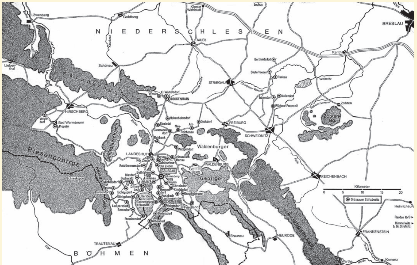
Mapa posiadłości klasztoru krzeszowskiego.

stości cystersi posiadali jedynie zamek Bolków (niem. Burg Bolkenhain) oraz wioskę Klein Waltersdorf, która dziś nie istnieje jako odrębna miejscowość, gdyż w 1929 roku została włączona w obręb miasta Bolków.