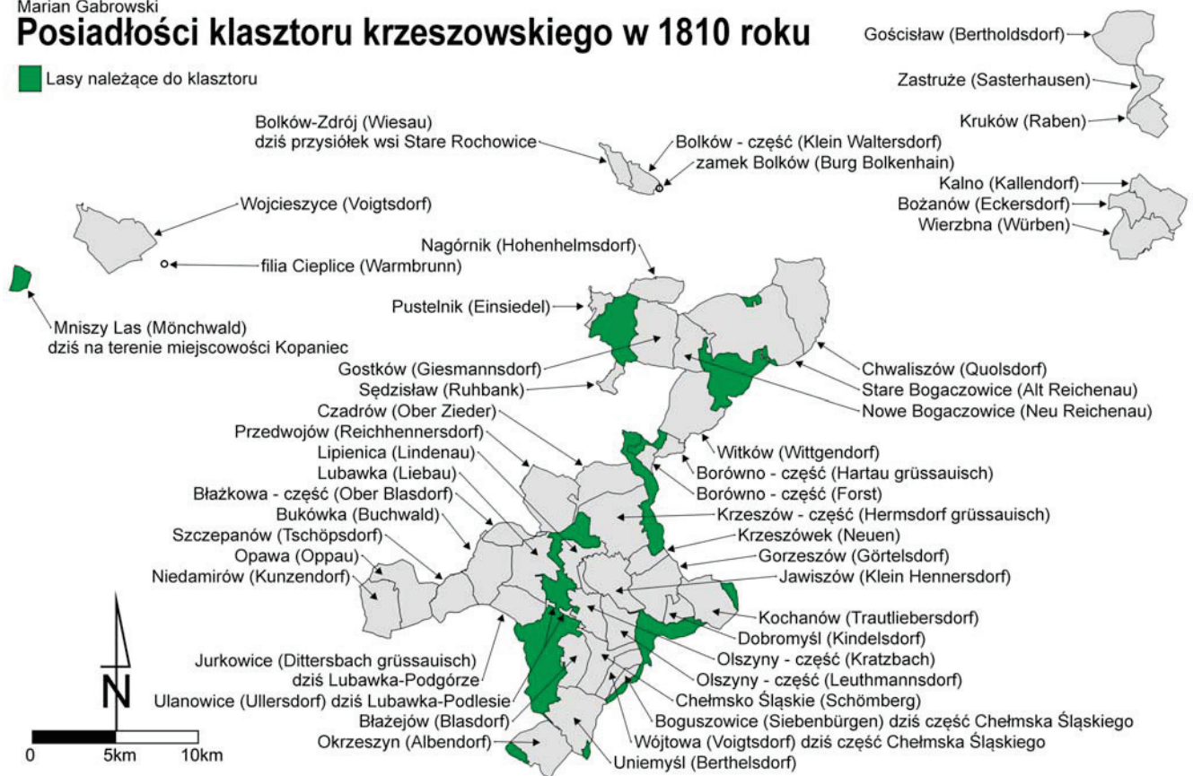
Posiadłości klasztoru krzeszowskiego w 1810 roku