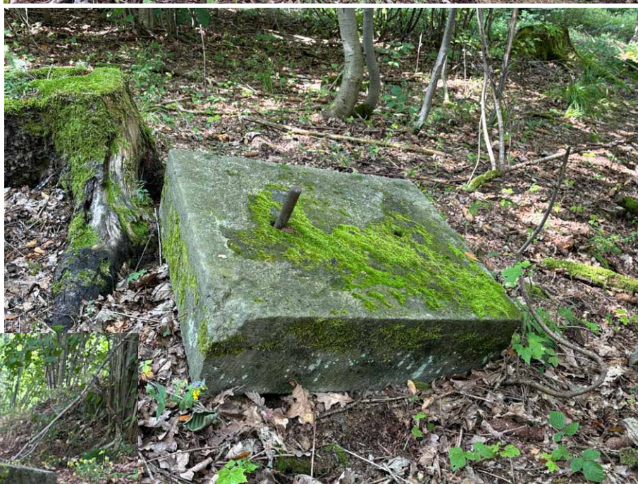
Fragment cokołu z wystającym stalowym prętem