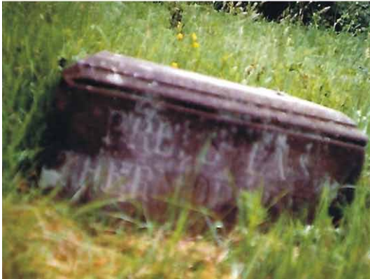
Szczałki pomnika. Zdjęcia: Wolfgang Schubert, 29 maja 2002 roku