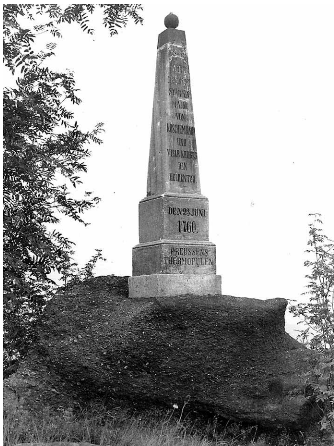
Pomnik stojący na górze Młynarz.