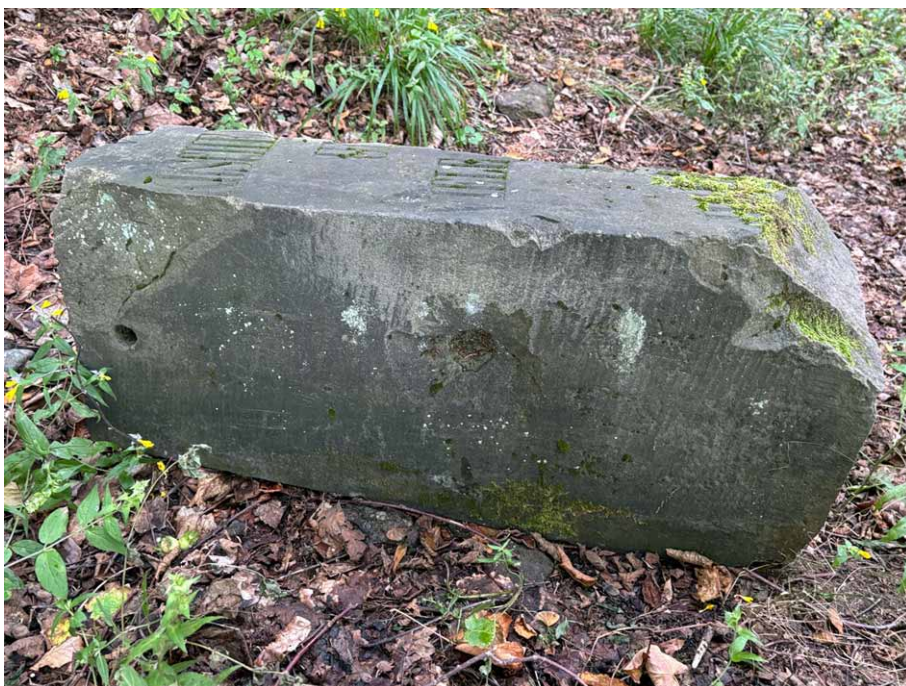
Lewy fragment obelisku