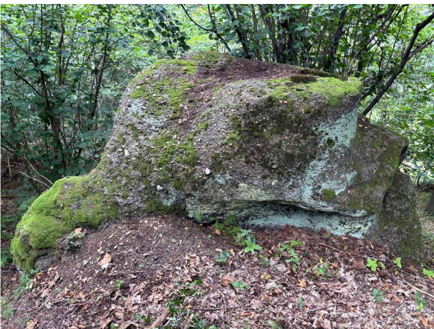
Skąła, na której ustawiono niegdys pomnik. Współczesne zdjęcia: Marian Gabrowski, sierpień 2024 roku

Na północnym zboczu Młynarza ustawiono pomnik upamiętniający bitwę. Stał pod szaniec na niższym, północnym wierzchołku. Obecnie pozostał po nim tylko cokół, natomiast fragment rozbitej płyty z napisem leżą na wierzchołku i zboczu poniżej cokołu 4 .