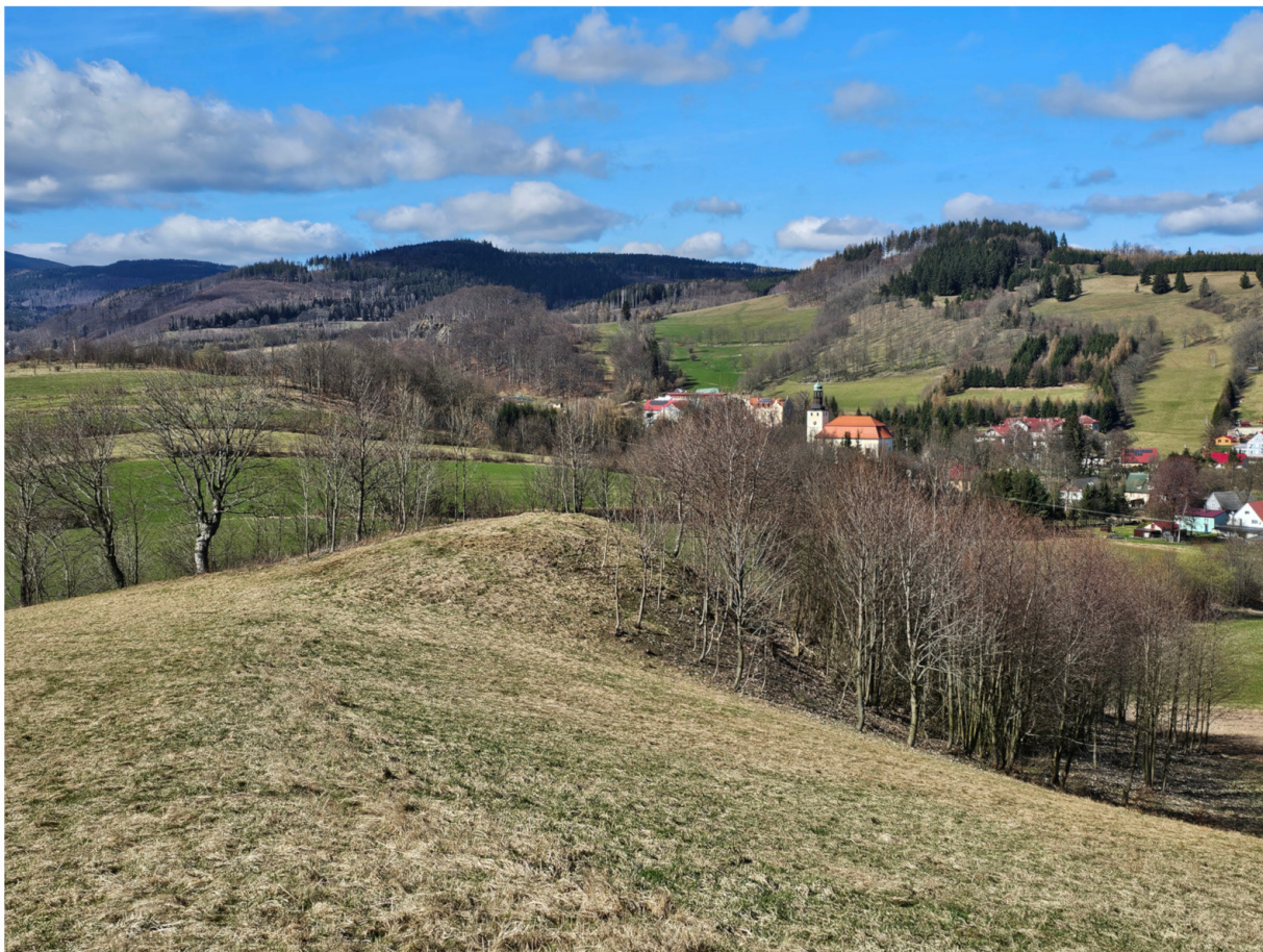
2. Bezimienny cypel na zboczach góry Przednia, fot. D. Wojtucki.

ba od lat zajmująca się badaniami miejsc straceń zauważył on, że na północny zachód od Przedniej znajduje się niewielki cypel, którego lokalizacja byłaby odpowiednia dla umiejscowienia szubienicy. Miejsce to wydaje się być zgodne z przywołanymi wcześniej opisami, jednakże jego potwierdzenia wymaga dalszych badań.