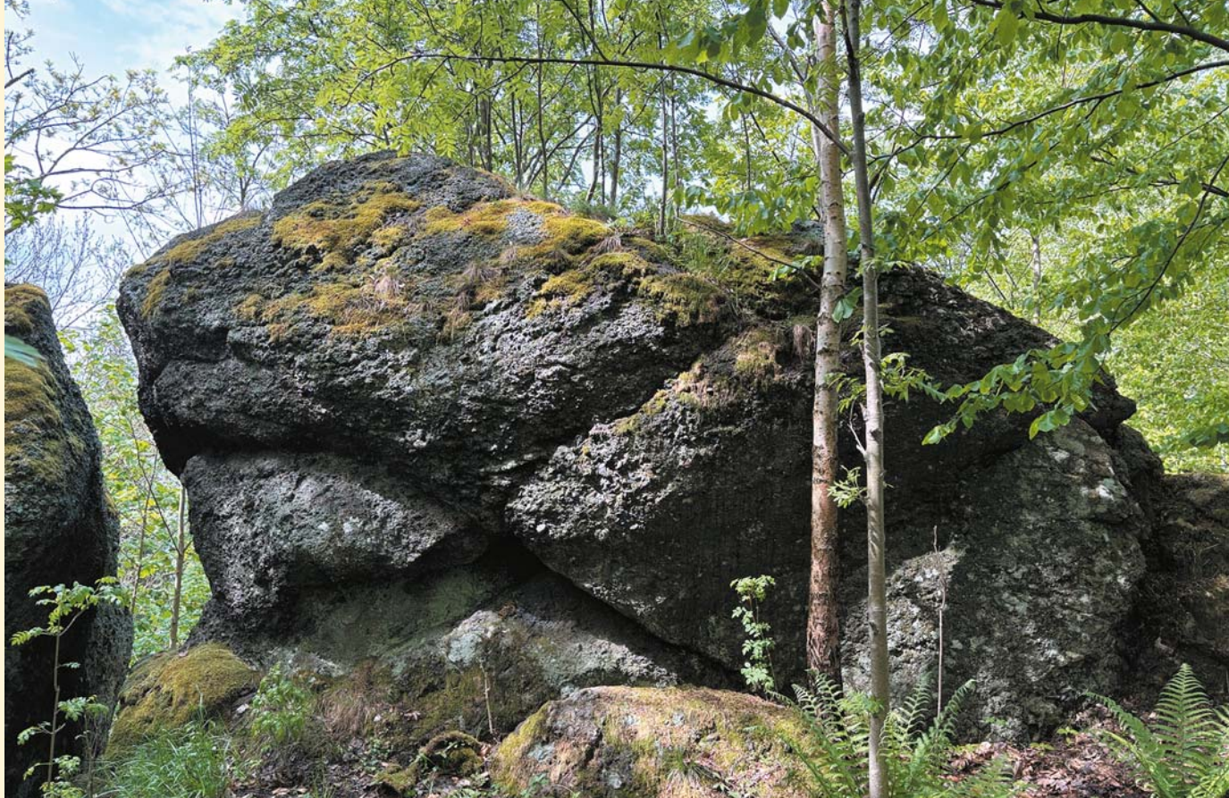
Dziurawa Skała widziana od strony wschodniej

materiału egzotycznego (być może skrzemieniałego fragmentu drzewa, tzw. araukarytu) z litej skały 11 .