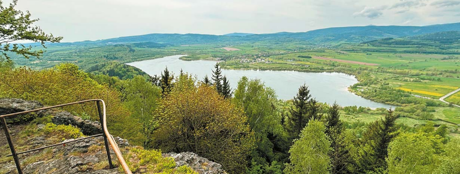
Zbiornik Bukówka widziany z punktu widokowego na szczycie Zadzierniej