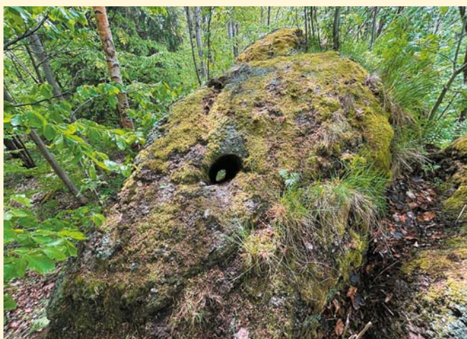
Wierzchołek Dziurawej Skały z wylotem tunelu

Z pewnością, wybierając się na Zadzierną, warto zobaczyć ten interesujący obiekt. Jednak okazuje się, że wcale nie jest to takie łatwe. Choć Dziurawa Skała, wspomniana na tablicach informacyjnych, znajduje się niecałe 200 m od dwóch szlaków turystycznych, to w terenie brak jakichkolwiek oznaczeń ułatwiających dotarcie do niej. Ja posiłkowałem się opisem Piotra Jochemy, który na swoim blogu „Wyszedł z domu” zamieścił szczegółowe wskazówki ułatwiające dotarcie do tego miejsca.