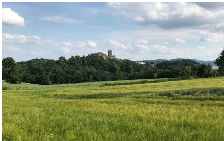
Zamek Bolków widziany z dawnej granicy wioski Wiesau, czerwiec 2019

Opisywany tu cysterski kamień graniczny z zamku Bolków jest jednym z najlepiej zachowanych tego typu słupków. Choć do czasów nam współczesnych zachowało się wiele niemal identycznych znaków, to zazwyczaj są one w mniejszym lub większym stopniu uszkodzone. Dodatkowo też wszystkie one posiadają trzycyfrowe numery porządkowe, które zostały na nich wtórnie dodane w czasach, gdy po likwidacji klasztoru pełniły funkcję słupków na granicy państwowej, podówczas jeszcze prusko-austriackiej. Brak tej liczby na bolkowskim zabytku sugeruje, że z jakiegoś powodu nie wykorzystano go do tej roli. To z kolei rodzi pytanie: kiedy i w jakich okolicznościach kamień ten znalazł się na zamku?