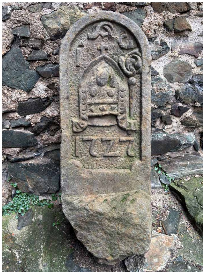
Współczesny wygląd kamienia granicznego, październik 2024

Być może jeszcze w 1727 roku? Trzeba tu bowiem zauważyć, że krzeszowscy cystersi na początku XVIII wieku stali się właścicielami zarówno zamku Bolków, jak i dwóch bezpośrednio z nim sąsiadujących miejscowości: Klein Waltersdorf, wioski włączonej w latach międzywojennych do miasta Bolków oraz Wiesau, dziś przysiółka Starych Rochowic o nazwie Bolków-Zdrój 4 .