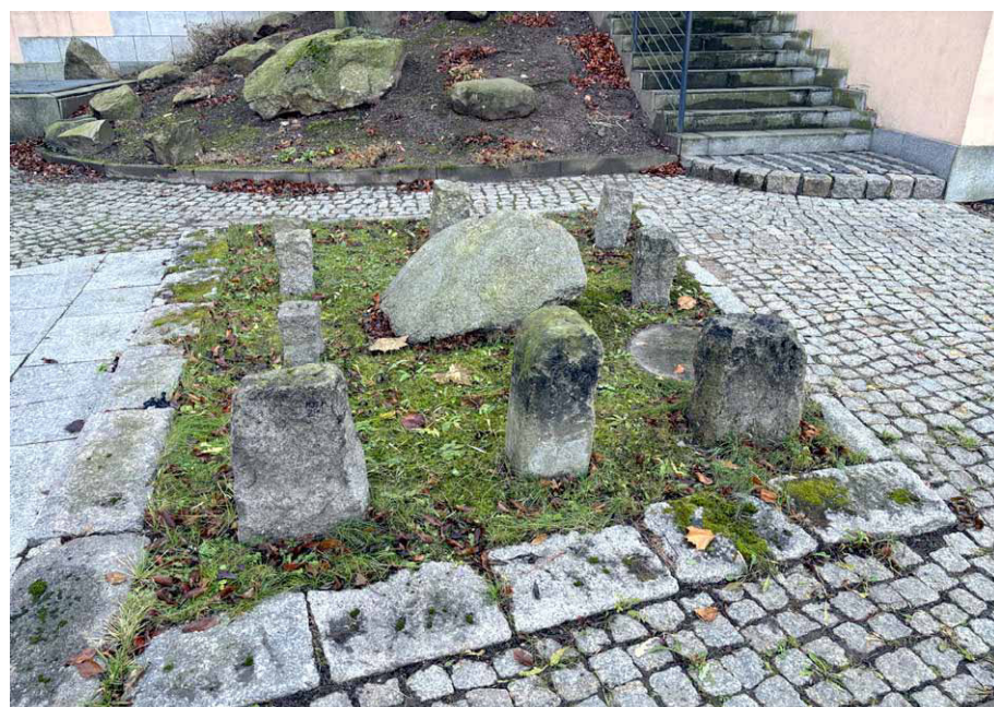
Kamienie graniczne ze zbiorów Muzeum Karkonoskiego, listopad 2024

Kamień, który znajdował się w depozycie Muzeum Okręgowego w Jeleniej Górze, przekazał mu konserwator z Jeleniej Góry. Warto więc w tym miejscu zauważyć, że przecież niegdyś jeden z cysterskich kamieni