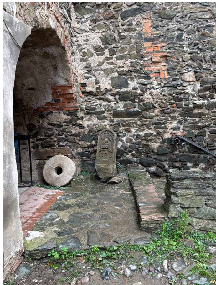
Słupek ustawiony obok innych zabytków przechowywanych w zamkowym lapidarium, październik 2024

wykuty z piaskowca. Podobnie jak inne nosi datę 1727, natomiast w przeciwieństwie do innych nie ma żadnego numeru. Inne kamienie cysterskie mają na bocznych ścianach wyryte numery kolejne 2 .