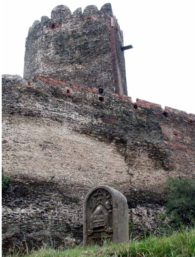
Kamień graniczny wkopany na trawniku dolnego dziedzińca zamku Bolków, lipiec 2008.

Informację tę jeszcze w tym samym miesiącu potwierdzili współtwórcy pisma, Iwona i Andrzej Scherer: Idąc za tropem podanym przez Jana Pelczarskiego, w dniu 18 lipca 1987 r. odwiedziliśmy muzeum, stwierdzając, iż jest to istotnie kamień graniczny dawnych dóbr cysterskich, mający wygląd taki sam, jak pozostałe znane kamienie graniczne. Mierzy on 93x31x20 cm,