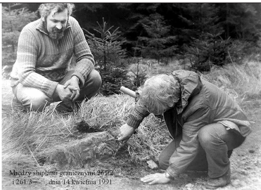
Między słupkami granicznymi 261/2 i 261/3 – dnia 14 kwietnia 1991

Wgnieciony w ziemię kamień graniczny. Zdjęcie: Jerzy Sarnecki, kwiecień 1991