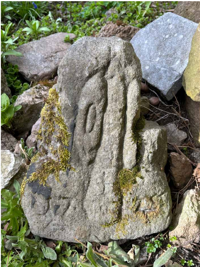
Jeden z kamieni w ogródku skalnym.