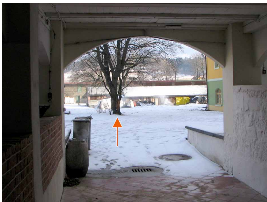
Brama przejazdowa, za którą niegdyś znajdował się opisywany kamień graniczny.