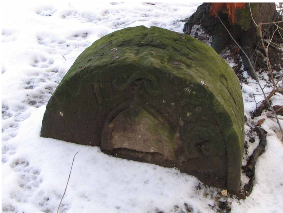
Kamień wkopany w ziemię do połowy swojej wysokości, styczeń 2008 roku

Co więc stało się z tym kamieniem? Z dostępnych mi informacji wynikało, że jego zniknięcie zbiegło się w czasie z remontem zabudowań klasztornych. Udało mi się ustalić, że przed rozpoczęciem tych prac zażytek postanowiono zabezpieczyć przed ewentualnym uszkodzeniem i przeniesiono go do budynku klasztoru. Co ciekawe, ten ciężki kamień trafił ostatecznie na klasztorny strych. Zapewne do transportu wykorzystano zamontowaną tam wciągarkę linową. Warto tu zauważyć, że dzięki trosce sióstr benedyktynek ten historyczny obiekt został całkowicie zabezpieczony nie tylko przed ewentualnym uszkodzeniem w trakcie prac remontowych, ale i przed szkodliwymi warunkami atmosferycznymi.