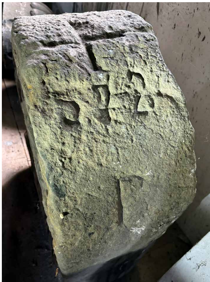
Prawa strona górnej części kamienia, sierpień 2024 roku

Tył znaku granicznego pozbawiony jest inskrypcji. Widać tu jednak wyraźnie ślady sugerujące, że niegdyś do połowy swojej wysokości był on pomalowany na biało.