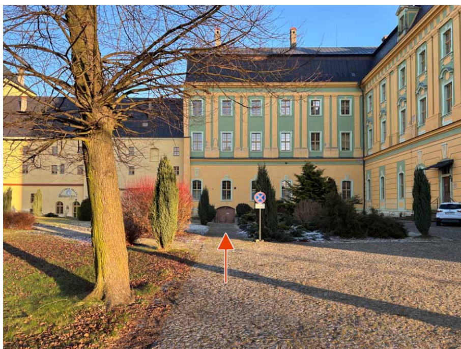
W styczniu 2008 roku kamień ustawiony był kilkanaście metrów na wschód za przejazdem pod klasztorem