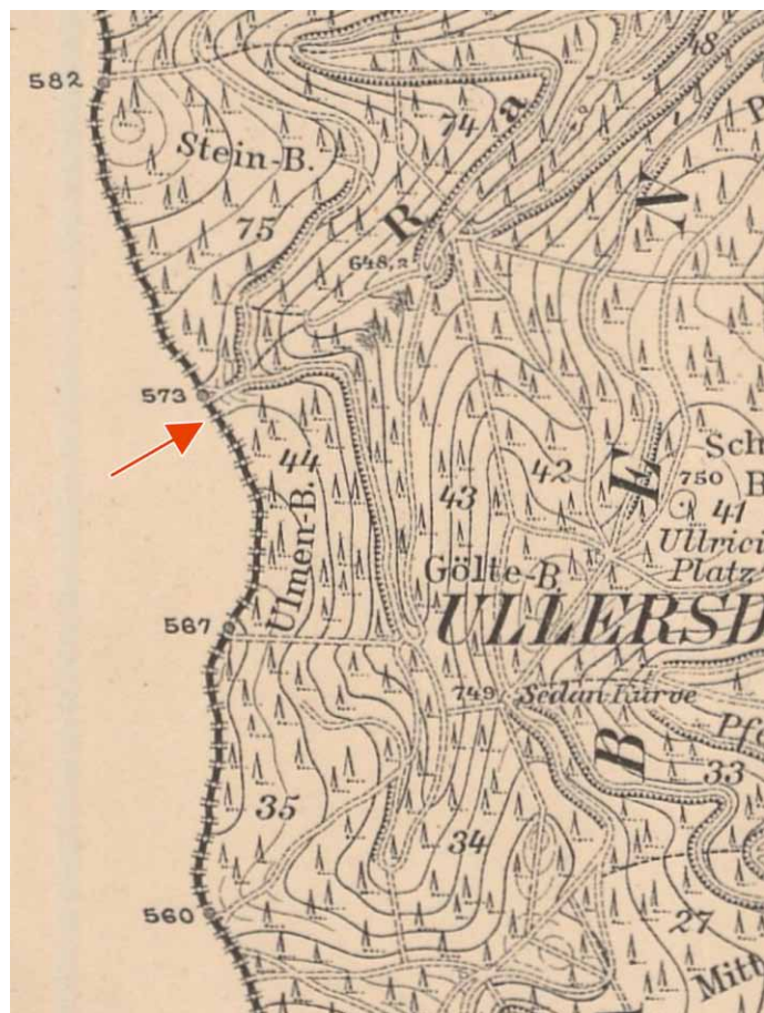
Fragment archiwalnej mapy topograficznej z zaznaczoną lokalizacją kamienia o numerze 572