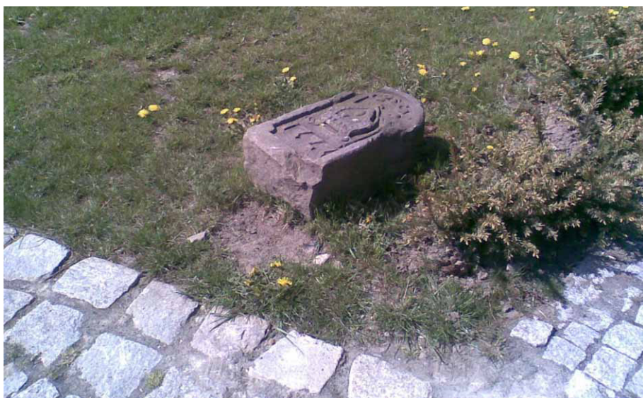
Przewrócony kamień graniczny przy alejce przed Domem Opata. Fotografia: Marian Gabrowski, maj 2009 roku