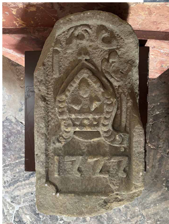
Widok z góry na leżący kamień. Zdjęcie: Marian Gabrowski, październik 2024 roku

Jednak moim zdaniem doszło tu do pomyłki. Być może Andrzej Scheer dopatrywał się tu nieco niespotykanej i chyba dość słabo czytelnej formy cyfry 2, która występuje