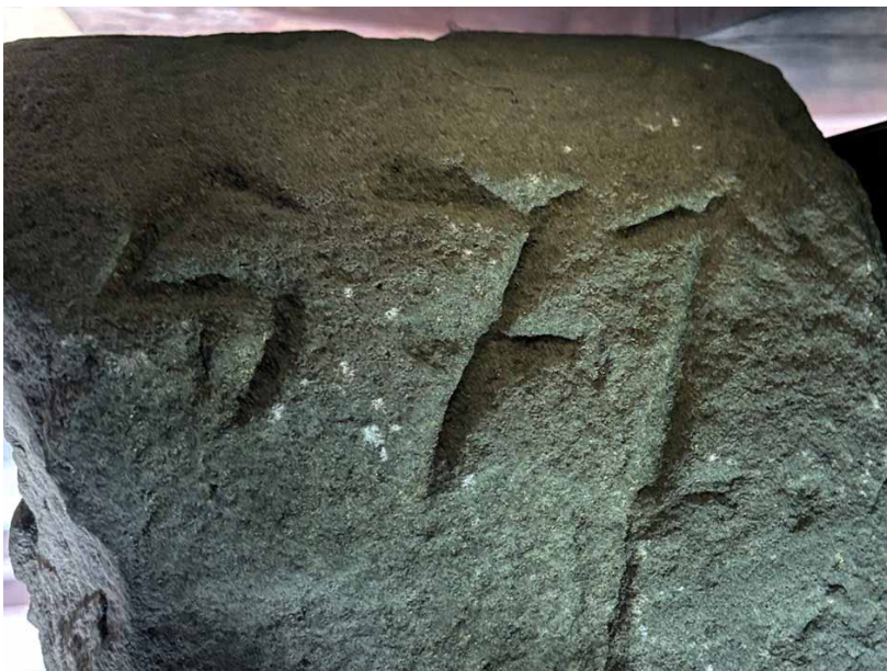
Trzycyfrowa liczba wyryta z boku kamienia. Zdjęcie: Marian Gabrowski, październik 2024 roku

13 A. Scheer, „Pobiesiadne” odkrycie kamieni granicznych , [w:] Przydrożne Pomniki Przeszłości, zeszyt 38, kwiecień 2004, s. 5.