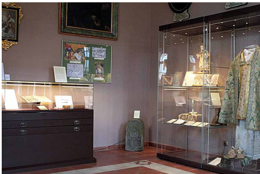
Kamień graniczny na ekspozycji w Domu Opata.

Kamień pozbawiony jest części, która pierwotnie miała znajdować się w ziemi. Przełom podstawy wydaje się na tyle nierówny, że