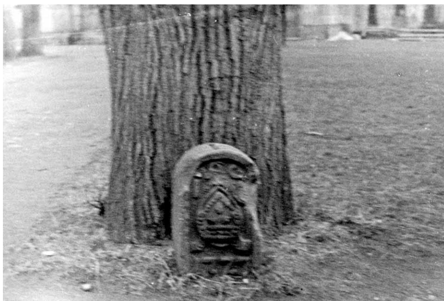
Kamień graniczny stojący na placu przed kościołem w Krzeszowie. Fotografia: Witold Komorowski, kwiecień 1967 roku

Nie wiadomo jednak dokładnie, od kiedy kamienia nie było w dawnym miejscu. Przez pewien czas jego losy były nieznane i dopiero