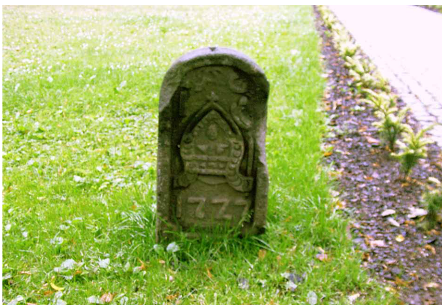
Kamień graniczny ustawiony po lewej stronie alejki wiodącej do Domu Opata. Fotografia: Marian Gabrowski, sierpień 2004 roku

W 2013 roku uznano, „że także Dom Gościnny Opata powinien służyć turystom. Zapadła decyzja, żeby w miejscu, gdzie były kuchnia i jadalnia, zorganizować muzeum” 10 . Rozpoczęto gromadzenie eksponatów, a jednym z nich stał się leżący przed budynkiem kamień graniczny, który wkrótce można było oglądać w roku jednej z sal wystawowych.