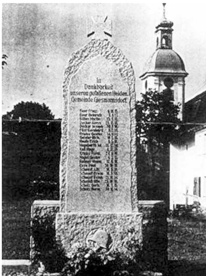
Przedwojenne zdjęcie ukazujące pomnik wojenny z wioski Giesmannsdorf.

Powyższe można przetłumaczyć jako: W hołdzie naszym poległym bohaterom, społeczność Gostkowa . Poniżej wryto nazwiska, imiona oraz daty śmierci 21 mieszkańców wioski. Ponieważ w roku 1911 w wiosce mieszkało 688 osób, toteż można oszacować, że w czasie pierwszej wojny światowej zginęło 3% ogółu mieszkańców, czyli nieco mniej niż w całym okręgu kamiennogórskim, gdzie średnia ta wynosiła 3,2%.