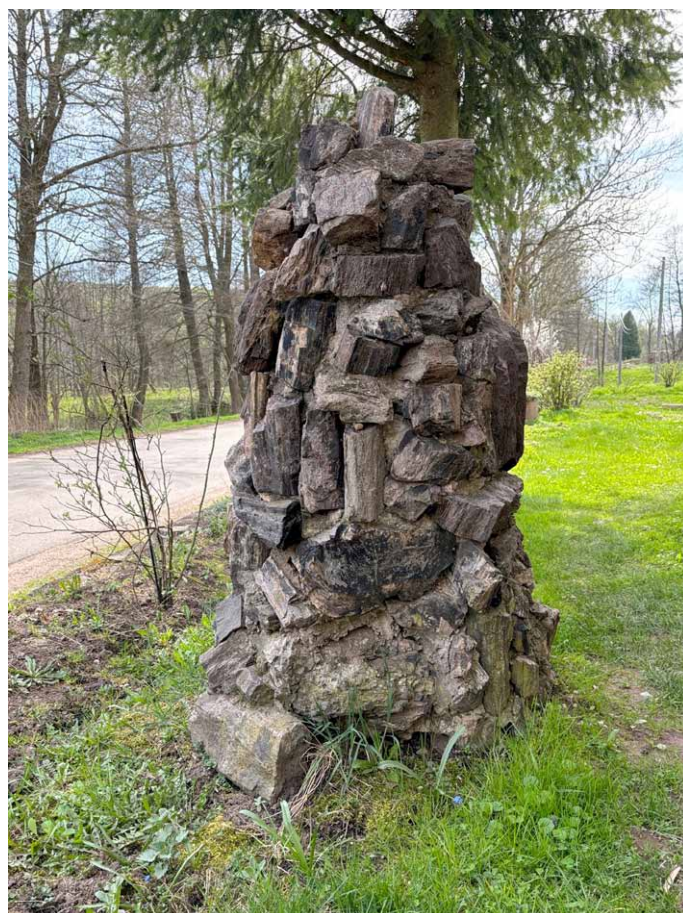
Kolumna wzniesiona ze skamieniałego drewna. Fotografia: Marian Gabrowski, kwiecień 2024 roku