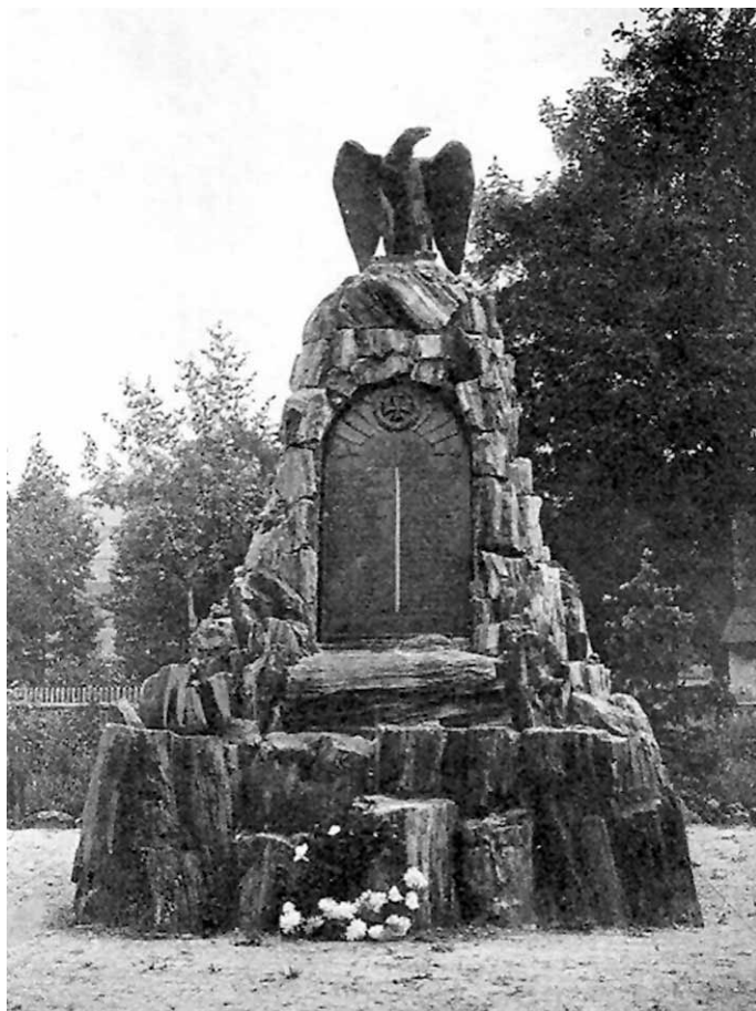
Przedwojenne zdjęcie ukazujące pomnik wojenny z wioski Albendorf

znajduje się w relacji jednego z dawnych mieszkańców wioski, który w 1995 roku napisał: Naprzeciwko sołectwa, w małym i zawsze bardzo dobrze utrzymanym kompleksie, gmina wzniosła pomnik wojenny poświęcony poległym w wojnie 1914/18. Również i on nie istnieje. Obecnie znajduje się tam zatoczka autobusowa. Wciąż stoi tam remiza strażacka 2 .