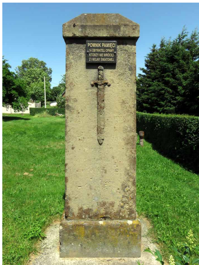
Wygląd pomnika w Opawie. Wszystkie zdjęcia: Marian Gabrowski, czerwiec 2022 roku