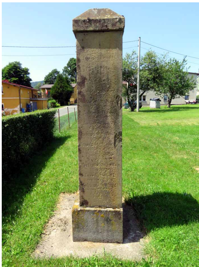
Widok boku pomnika skierowanego w kierunku wschodnim