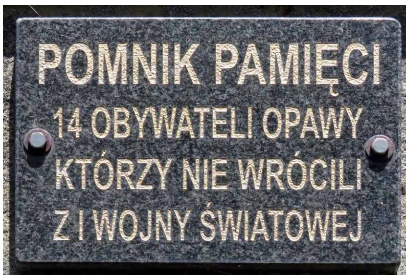
Powojenna tablica w języku polskim

POMNIK PAMIĘCI 14 OBYWATELI OPAWY KTÓRZY NIE WRÓCILI Z I WOJNY ŚWIATOWEJ