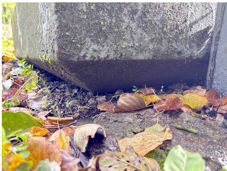
Ścięta dolna krawędź kamiennego bloku leżącego przed krzyżem

Choć w najbliższej okolicy nie dostrzegłem żadnych kamiennych pozostałości dawnego pomnika, to moją uwagę przykuła leżąca przy samym krzyżu kamienna płyta. Jest to piaskowcowy blok o wymiarach 78×78 cm. Wysokość jego bocznej powierzchni to 20 cm, przy czym bardzo zaskoczył mnie fakt, że dolna krawędź jest ścięta tak bardzo, że nie sposób zmierzyć całkowitej grubości kamienia.