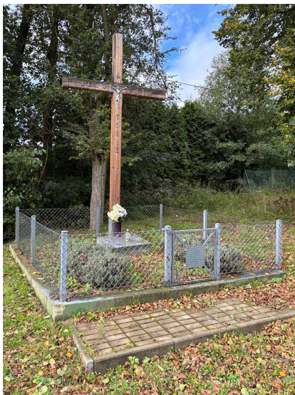
Krzyż ustawiony w miejscu pomnika. Współczesne zdjęcie: Marian Gabrowski, październik 2024 roku

Ponieważ tego typu ukośna obróbka krawędzi występuje zazwyczaj na górze kamiennych bloków, toteż podejrzewam, że element ten został odwrócony do góry nogami. To z kolei sugeruje, że płyta ta pierwotnie stanowiła podstawę pomnika wojennego, którą zaznaczyłem na archiwalnej fotografii strzałką.