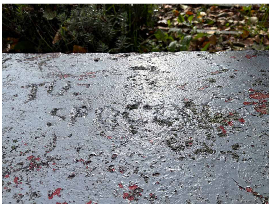
Słabo czytelne litery tworzące napis TU SPOCZYWA

Przy czym kamień ten ma chyba jeszcze ciekawszą historię. Patrząc z boku na jego górną powierzchnię, zauważyłem, że widać tu litery wyryte pod kilkoma warstwami farby olejnej. Są one dość słabo czytelne, ale układają się w początek napisu: TU SPOCZYWA. Nie potrafię odnaleźć kontynuacji tej inskrypcji, która albo uległa całkowitemu zatarciu, albo też nigdy nie powstała.