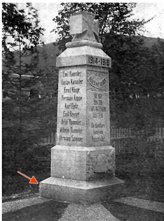
Archiwalne zdjęcie pomnika (strzałka wskazuje zachowany do dziś fragment podstawy).